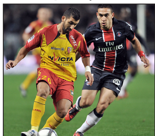
جانب من لقاء سان جرمان افيغنون