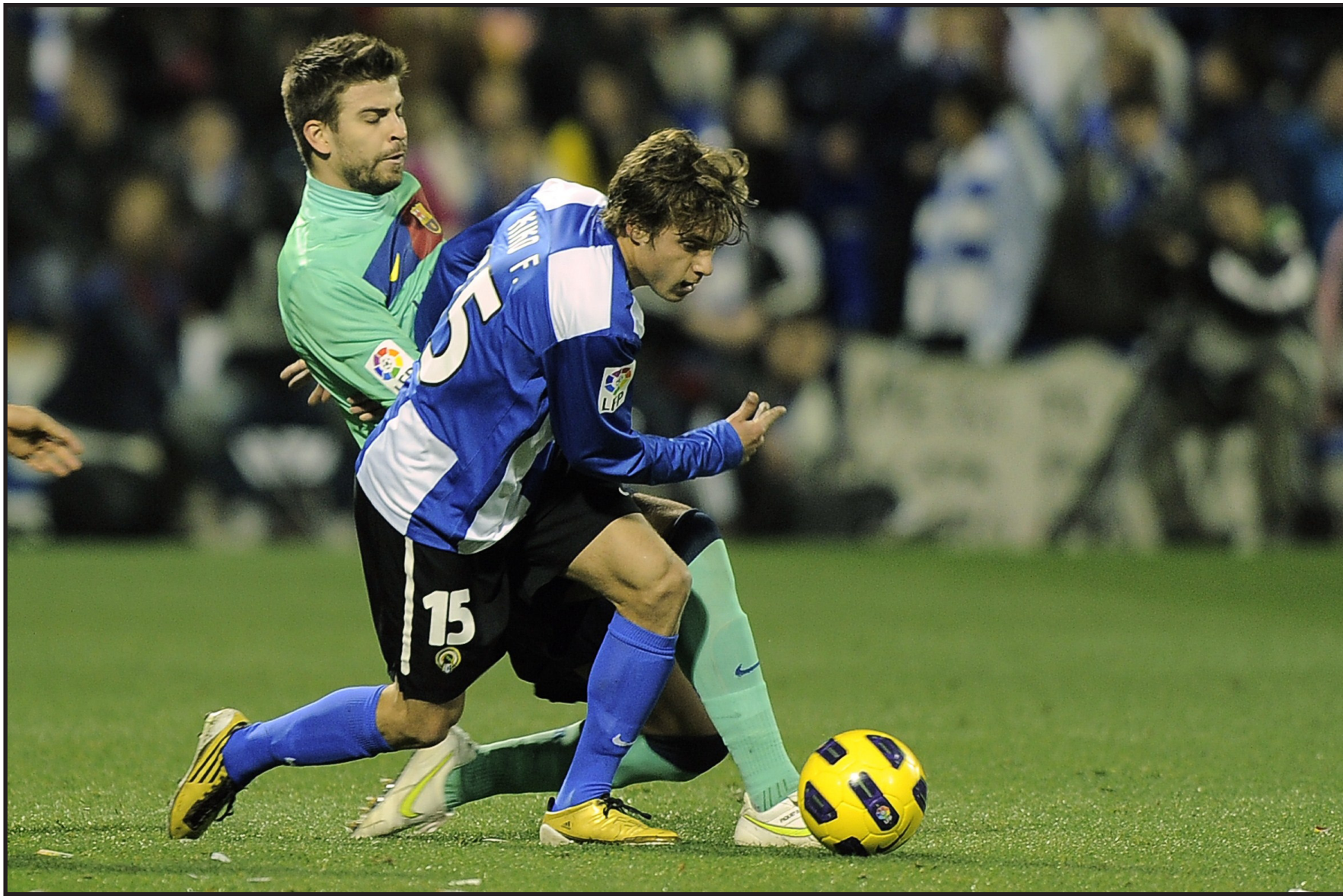
برشلونة يضيف ثلاث نقاط مهمة الى رصيده