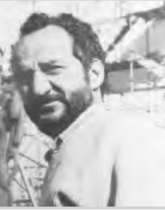
كاظم السيد عليا

الفنية بإبداعه الذي نال الإعجاب من خلال نصبه الخالد (الحرية) الشامخ في منتصف العاصمة الحبيبة بغداد.. الكل يعرف أن الفنان الراحل نشأ وترعرع وسط عائلة فنية عرفت بنشاطها الفني آنذاك.. واستمر وبعد تخرجه من الدراسة المتوسطة وفي الثلاثينيات بالضبط بدأت الحكومة العراقية.. بإرسال بعثات دراسية إلى أوروبا لغرض دراسة الفن هناك.. فكان لجواد نصيب في تلك البعثة.. فأرسل إلى باريس عام ١٩٣٨، وبعد اندلاع الحرب العالمية الثانية.. ذهب إلى روما.. ثم عاد إلى بغداد بعدها شععه طموحه على أن يسافر إلى انكلترا من أجل إكمال دراسته في المدارس الفنية العالمية فأخذ جواد يرسل والدته في بغداد برسائل.. لكنها على شكل قصائد شعبية.. لكونه كان يمتلك موهبة كتابة الشعر إلى جانب موهبته الفنية التي برز وبع اسمه بين الفنانين العالميين من خلال مشاركته الفنية في المعارض العالمية.. وفي هذه الرسائل عبر سليم عن شدة وجده وحزنه لفراق (أمه) الحبيبة.. فبعد أن وصلت رسالته إلى من الوطن الحبيب.. وبعد أن قرأها وابتهج لها