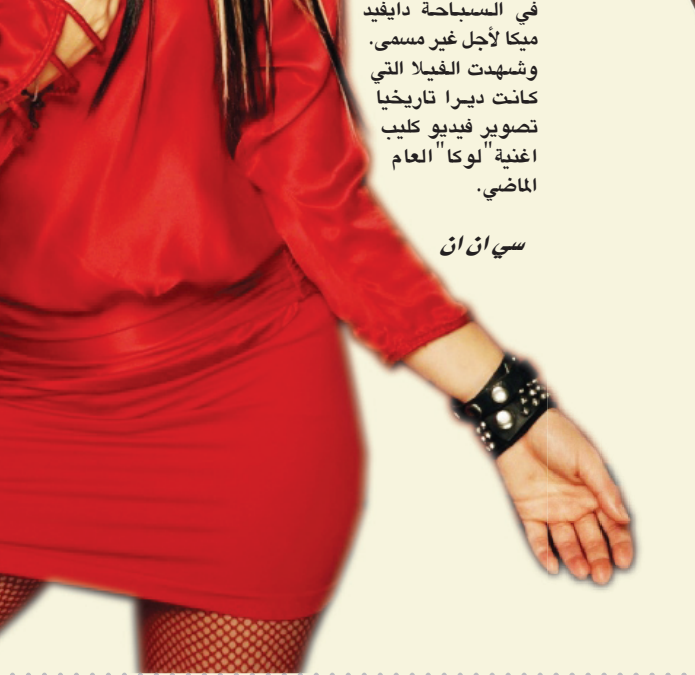
بي بي سي