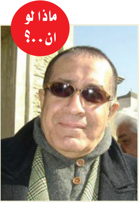
ماذا لو ان ٤٠٠؟

عاما... ساقول له حقق هذه الجدارية لصلاح القصب كي تكون شامخة مع جدارية جواد سليم. لو أصبحت وزيرا للمالية؟ أمنح فقراء العراق راتباً مستمرا كي يلتقوا مع الفرحة. لو طلبت منك أن تكون صريحا أمام رئيس الوزراء بماذا تجيب؟ أن يملاً شوارع بغداد بالفرح والألوان الزاهية وأن يجعل من العراق ذلك الحلم الذي ينشده تاريخ العراق. لو سرق نشالا محفظتك؟ أتمنى أن يعيد لي هويتي ويعيد المحفظة بدون نقود وسأمنحه النقود كي لا يسرقني ثانية! لو زوجتك تشارجك بالموبايل؟ سأتركها تتحدث لأنني لا أصغي لها كما تريد