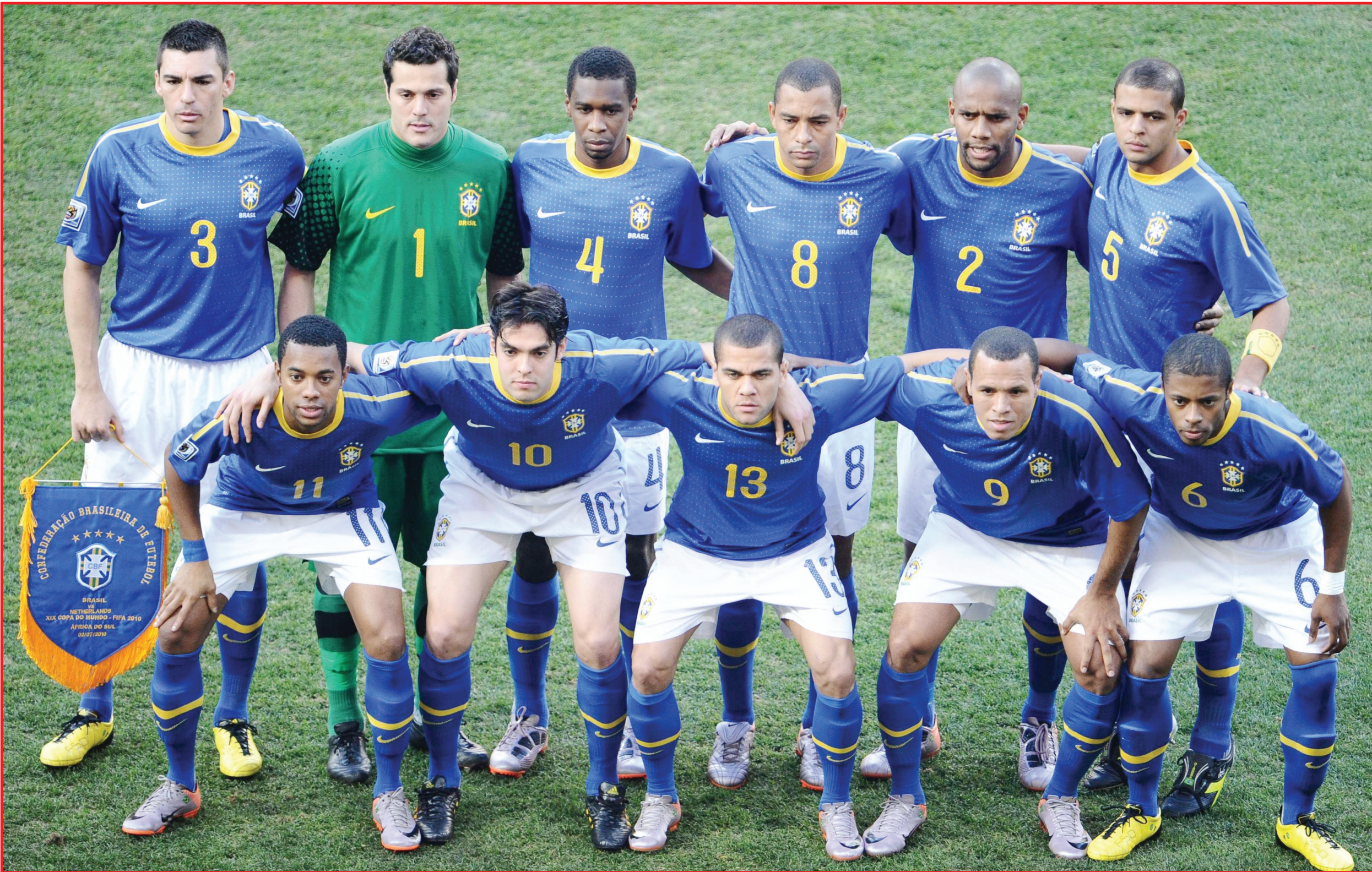
منتخب البرازيل يواجه فرنسا في لقاء تجريبي مثير..