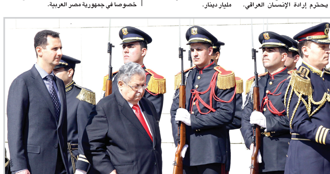
الاسد خلال استقباله طالباني في دمشق.. أ.ف.ب

وتمت في الجلسة التي عقدت فور وصول الرئيس إلى دمشق مناقشة العلاقات بين البلدين وسبل تطويرها والارتقاء بها، إضافة إلى مناقشة التطورات في المنطقة خصوصا في جمهورية مصر العربية.