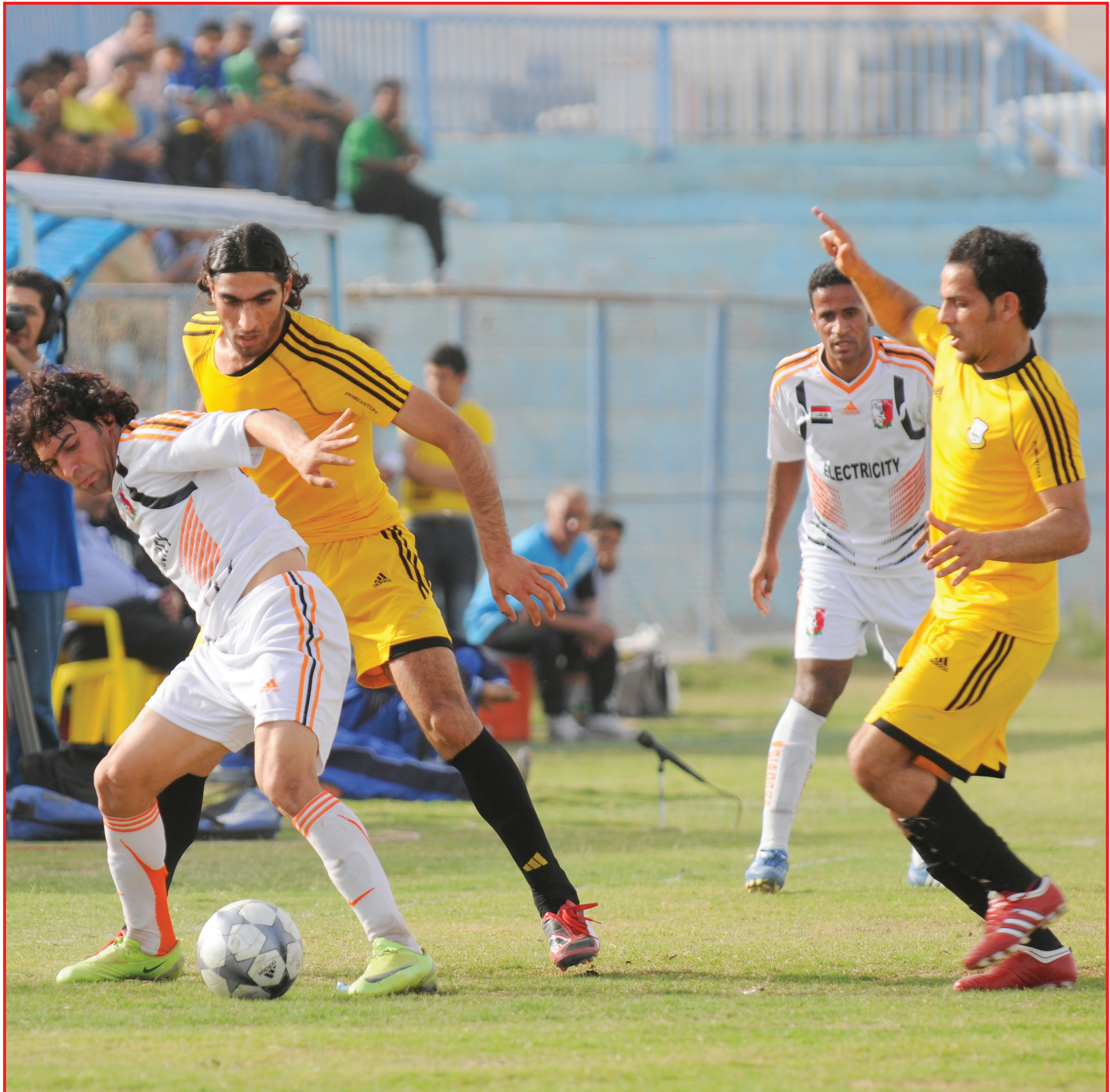
أربيل يسعى لملاحقة فرق الصدارة عبر بوابة الموصل..