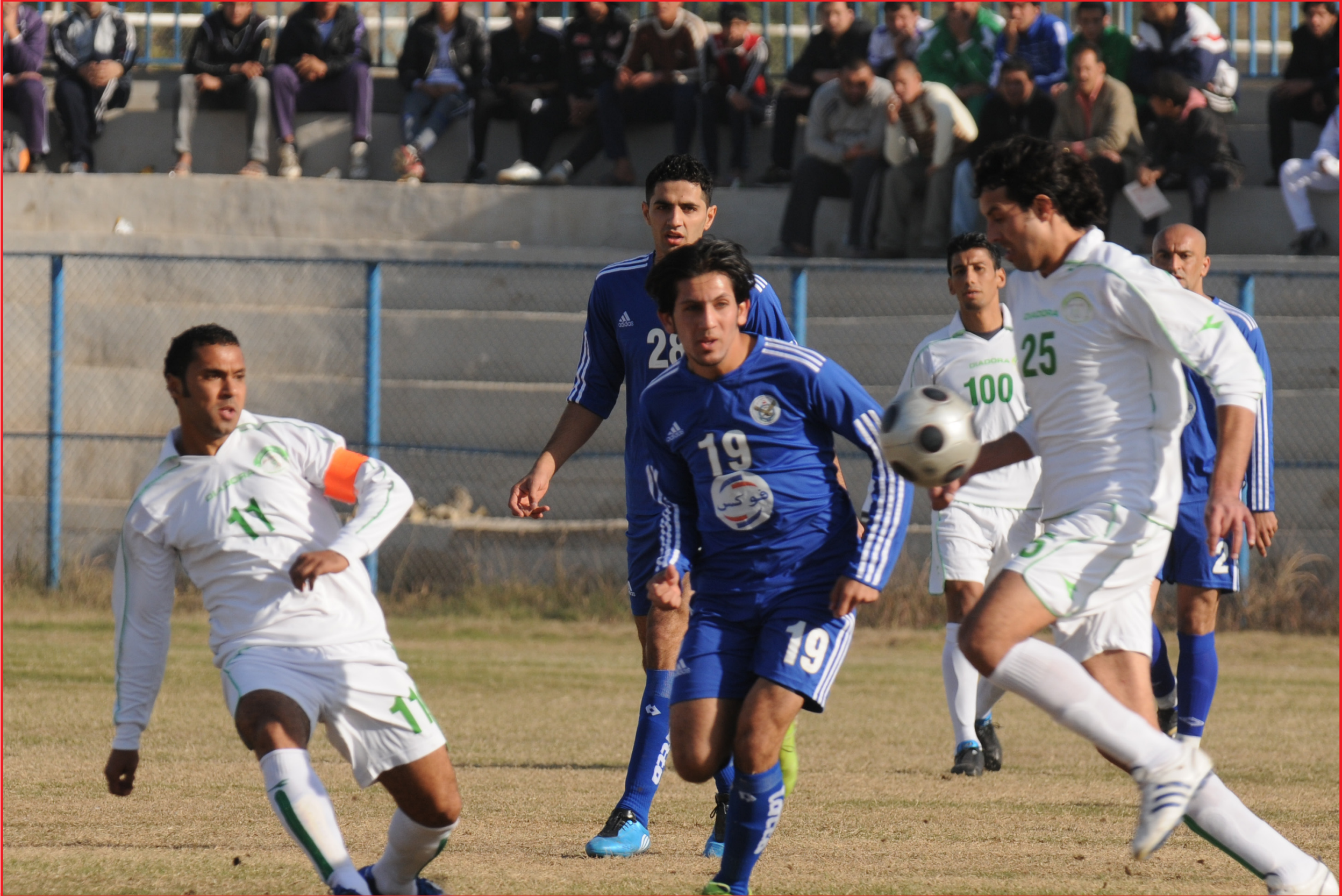
صراع الدوري يدخل محطات مثيرة...