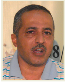
الأطفال: إن عمل الجوال يتلخص بتوجيه اهتمام أطفال المدارس إلى تقديم عروض

سرحية ومسرح الدمى ومقاطع (سكيجات) تعرف الطفل بحقوقه وعروض سينمائية بالإضافة إلى الورش الفنية والرسم، وأضاف كما يقدم الجوال مجموعة من إصدارات ثقافة الأطفال مثل مجلة مجلتي والمزمار وسلسلة مكتبة الطفل، وأشار إلى أن الدائرة ستفتح وزارة العمل والشؤون الاجتماعية لغرض تسهيل عمل الجوال وزيارة المدارس وأطفال دور الدولة والأيتام. احتفت محافظة ذي قار بمبعديها من الأدباء والكاتب العلمي والتاريخي والترائي.