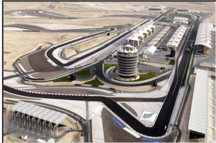
حلبة البحرين بانتظار الحسم

جائزة البحرين الكبرى، سيبدأ الأسبوع المقبل. وكان من المقرر إقامة المرحلة الأولى من بطولة العالم لسباقات فورمو لا المقررة في 13 آذار على حلبة صخير في البحرين التي تعاني حالياً أزمة سياسية وأعمال عنف. وقال إيكليستون في تصريح لوكالة "أسوشيتد برس" البريطانية: "الأسبوع المقبل سننشد قراراً وستقرر ما سنفعله". وأردف قائلاً "حدثت هذا الصباح مع ولي العهد الأمير سلمان بن حمد بن عيسى آل خليفة، أنه لا يعرف أكثر منكم أو مني، لكنهم يتابعون عن كثب سير الأحداث". وتشهد البحرين احتجاجات دامية يطالب فيها المحتجون باستقالة حكومة رئيس الوزراء خليفة بن سلمان آل خليفة.