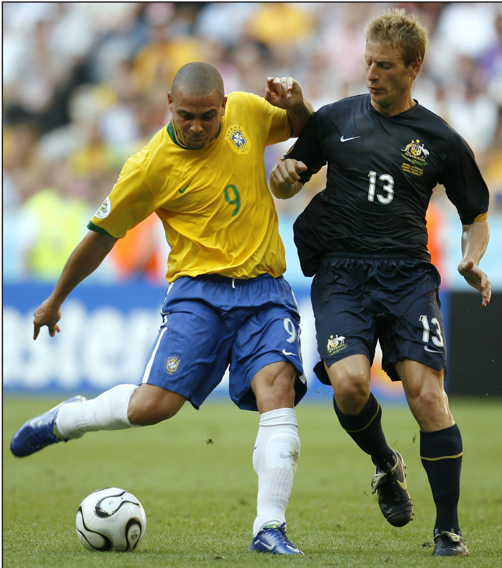
رونالدو يودع الملاعب ويبنى قصته الكروية

رونالدو . في عام 2007 قاد نادي أي سي ميلان الإيطالي للفوز في المباراة النهائية على نادي سيفيلا الإسباني 3-1 وحقق رونالدو مع نادي ريال مدريد لقب الليغا الإسباني مرتين وكانت في موسمي 2003 و 2007 وفاز رونالدو مع نادي برشلونه على لقب سيفيلا بثلاثة أهداف مقابل هدف واحد، وحصل رونالدو على لقب كأس السوبر الإسباني مرتين الأولى مع نادي برشلونه في عام 1996 والثانية مع نادي ريال مدريد الإسباني عام 2002. وفي موسم 1996 فاز رونالدو مع نادي أينهوفن الهولندي بلقب كأس هولندا وإضافة إلى ذلك فاز رونالدو بلقب كأس البرازيل مرتين الأولى مع نادي كروزيرو بيلو هيرتسوتتا في عام 1993 والثانية مع نادي كورنثينسيون في عام 2009. وحصل رونالدو على لقب أحسن لاعب في العالم ثلاث مرات وكانت في مواسم 1996 و 1997 و 2002 وحصل أيضاً على لقب أحسن لاعب في أوروبا مرتين وكانت في موسمي 1997 و 2002.