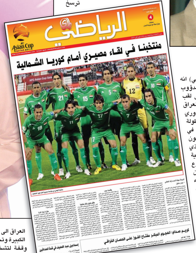
صورة من ملحق (المدى الرياضي) أثناء بطولة أمم آسيا

العراق إلى مستوى الأحداث الكبيرة وتحتاج إلى أكثر من وقفة لتتخصص ما تعانیه الصحافة الرياضية برغم وجود اتحاد مثابر للصحافة الرياضية وحريص على ان يأخذ بأسباب النجاح ليضع من خلالها الصحفي الرياضي على السكة الصحيحة لكن ما تعانیه البلاد من ظروف لا تعد بأي شكل من الأشكال مثالية لنجاح يحقق الطموح لدى الوسط الصحفي الرياضي، ولهذا وجدنا هناك الكثيرين ممن تجاهلوا