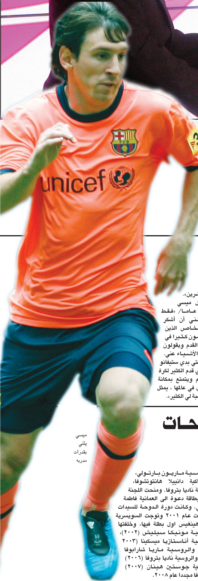
ميسي بذرات مدربه