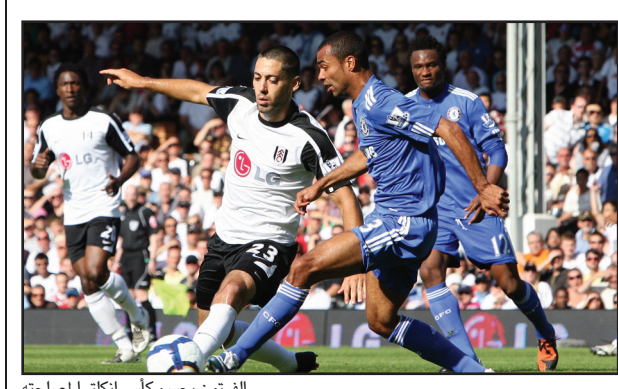
الفرنون يحسم كأس إنكلترا لصالحه

جرد إيفرتون مضيفه تشيلسي من لقبه بطلا لكأس إنكلترا لكرة القدم في النسختين السابقتين بفوزه عليه بركلات الترجيح ٣-٤ (الوقت الأصلي صفر-صفر والإضافي ١-١) في مباراة معادة بينهما من الدور الرابع على ملعب ستامفورد بريدج. وكانت المباراة الأولى على ملعب غوديسون بارك قد انتهت بالتعادل ١-١ أيضا. وثار إيفرتون بالتالي لخسارته أمام تشيلسي ٢-١ بالذات في نهائي المسابقة الموسم الماضي ملحقا به أول خسارة فيها منذ سقوطه أمام بارنسلي في الدور ربع النهائي في آذار عام ٢٠٠٨. ولم يشارك المهاجم الإسباني فرناندو توريس في صفوف تشيلسي كونه خاض هذه المسابقة في صفوف ليفربول هذا الموسم. واعتمد الفريقان