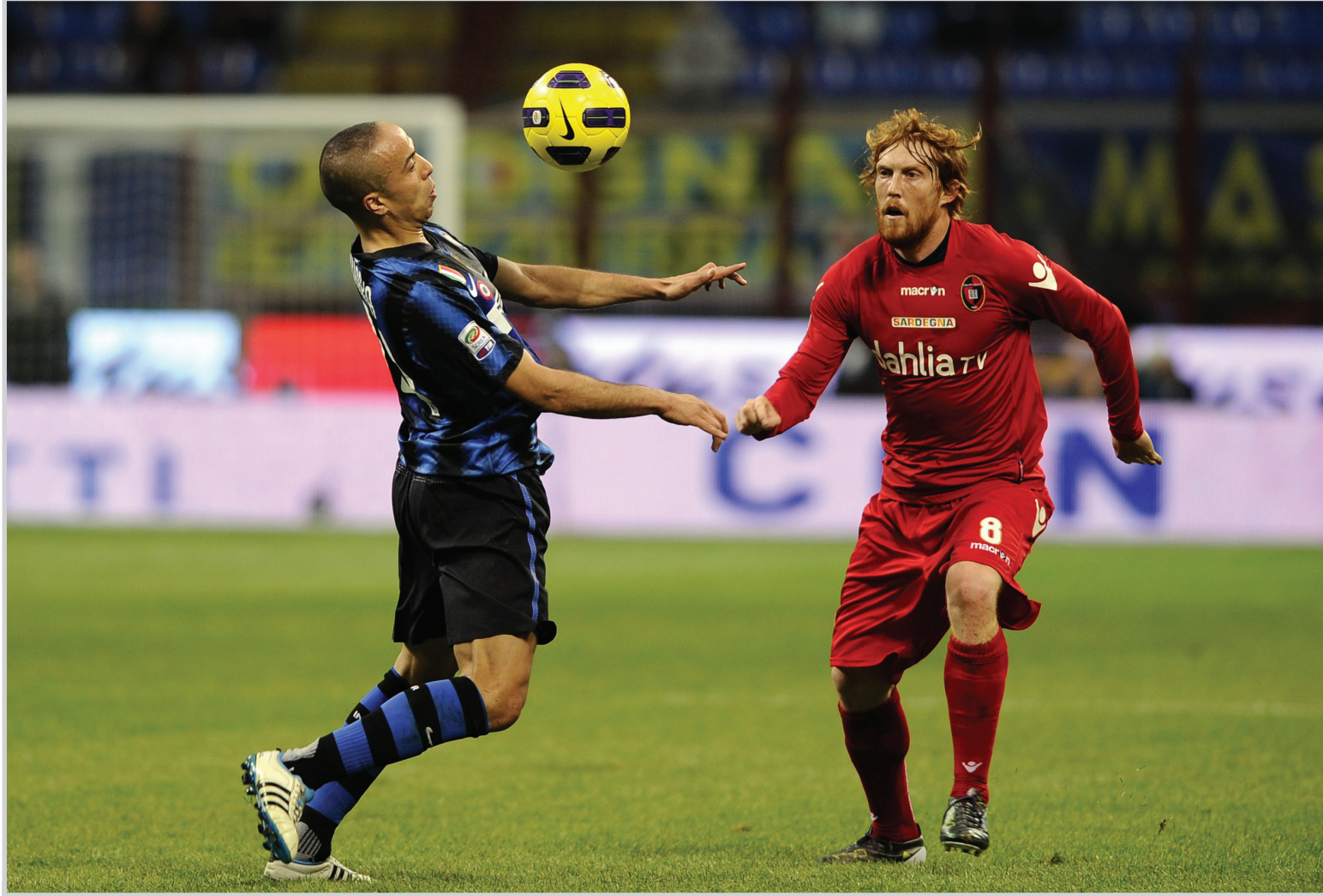
الإنتر يترقب حسم جولته مع البايرن

الربع الاخير من المععب... ندرك ذلك وستحسن، لكن بشكل عام أنا مرتاح الانكليزي على ملعب «فيلودروم» جدا.