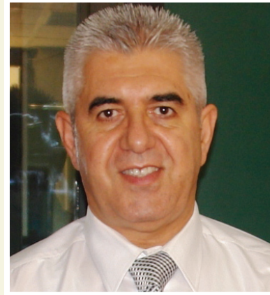
د. عادل فاضل

رد مصدر مسؤول في اللجنة الاستشارية الفنية المشكلة من قبل اللجنة الفنية على تصريحات الأمين العام للجنة الأولمبية د. عادل فاضل التي نفي فيها ما جاء في بيان اللجنة الفنية بشأن تقليص وإلغاء بعض الفعاليات في الدورة العربية المقبلة المزمع إقامتها في العاصمة القطرية الدوحة نهاية العام الجاري. وقال المصدر في توضيح تلقت (المدى الرياضي) نسخة منه: يبدو ان الأمين العام للجنة الأولمبية لا