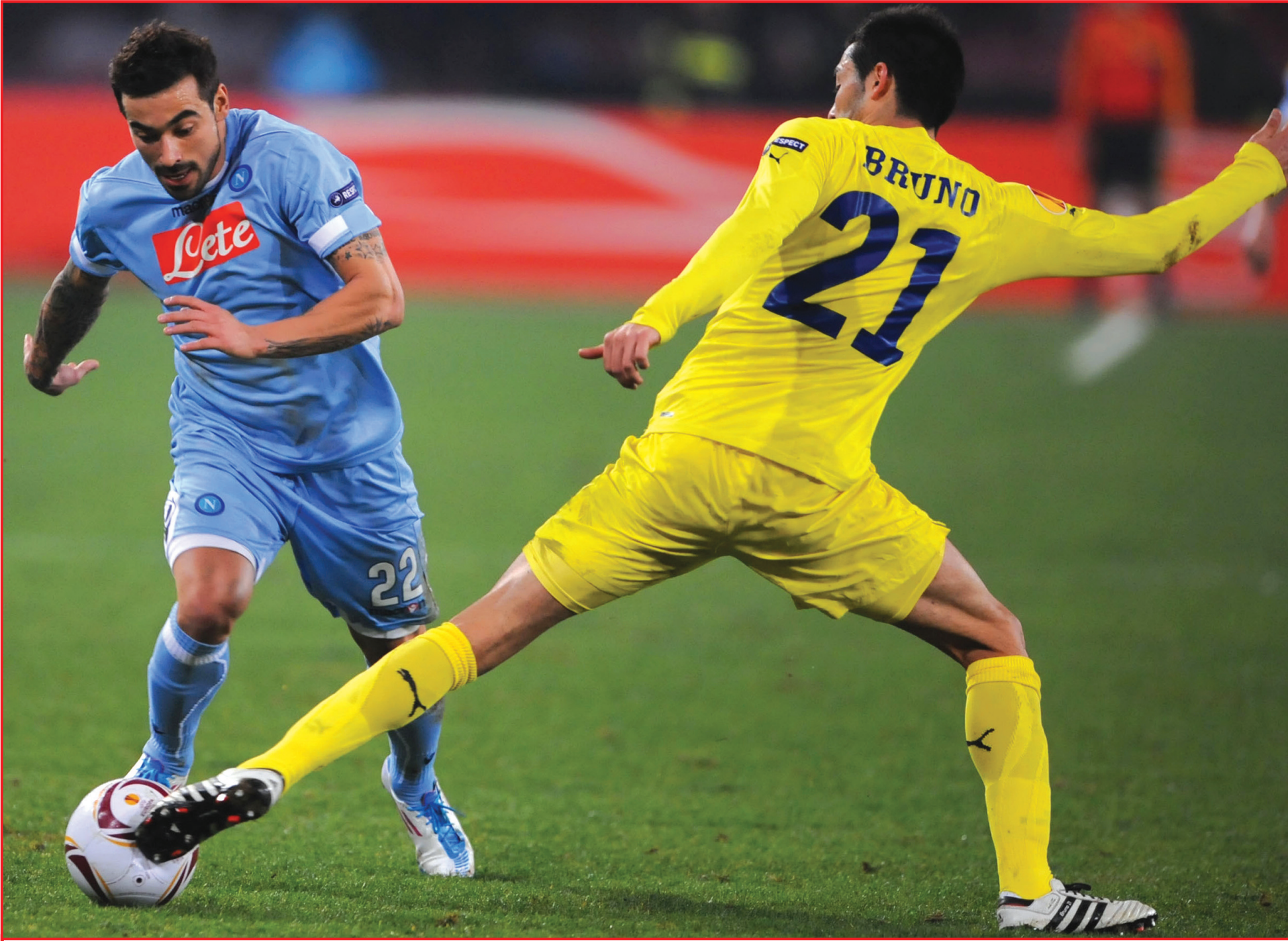
نابولي في ضيافة فياريال ضمن إياب الدور الثاني لدوري أوروبا 10 ف ب