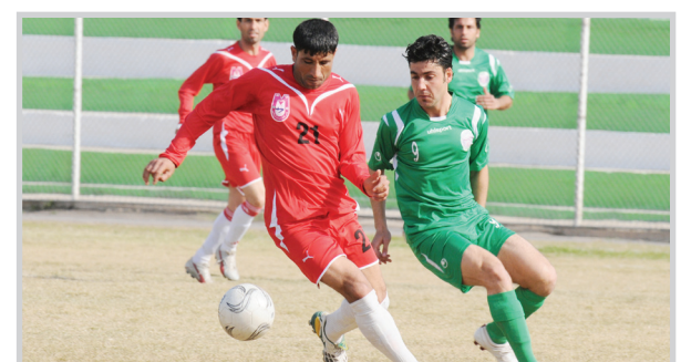
الشرطة في مهمة صعبة اليوم صوب ملعب النفط حيث يخوض فريقهم واحدة من أصعب المباريات بسبب تعرضه الى خسارة وتعادل هزيل