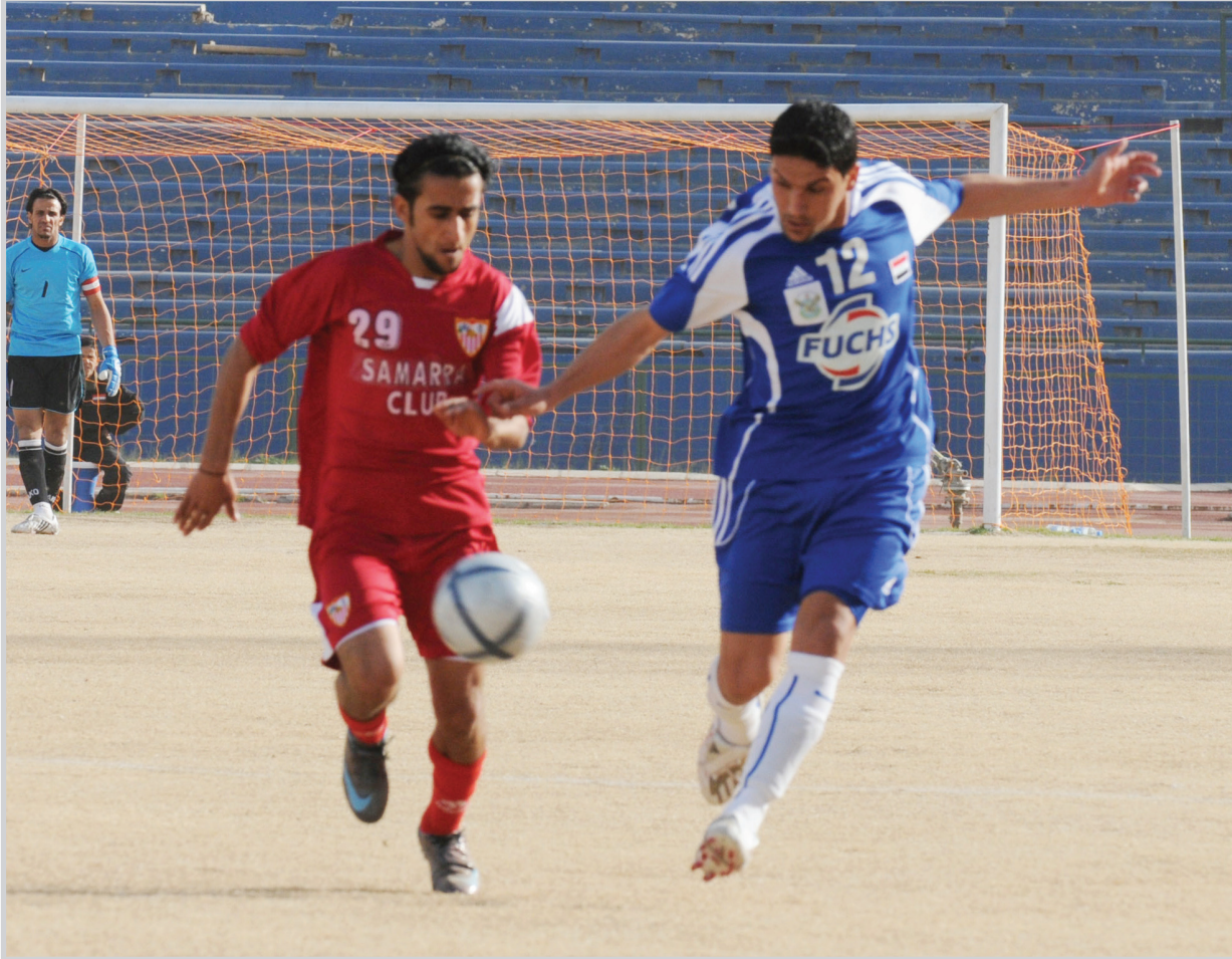
سامراء يسعى لاحراز أول هدف في مرمى الموصل