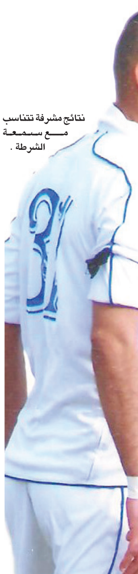
نتائج مشرفة تتناسب مع سمعة الشرطة .

لعب فريق الكهربية خارج بغداد ثلاث مباريات لم يفرز بها، فتعادل في مباراتين وخسر الثالثة وأحرز فيها هدفا واحدا. لم يسجل فريق ديالى في آخر مباراتين، لكنه حافظ على نقطة واحدة في مباراتين من لقاءاته الثلاث الأخيرة، ولعب على ملعبه خمس مباريات فاز بثلاث منها وتعادل في واحدة وخسر الأخرى، ولم يسجل أي هدف في الشوط الثاني بالمباريات الخمس الأخيرة.