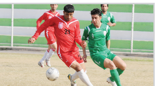
الشرطة في مهمة صعبة اليوم صوب ملعب النفط حيث يخوض فريقهم واحدة من أصعب المباريات بسبب تعرضه الى خسارة وتعادل هزيل

برصيد ٢١ نقطة خلف المتصدر بفارق ٣ نقاط. وتتجه أنظار أنصار الشرطة وجمهوره