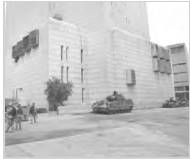
وزير الموارد المالية يستقبل السفيرين المصري والصيني في بغداد

بغداد / تصمم التصميميا افتتح المزاد الخامس لحوالات الخزينة ذات (٩١ يوما) وبقيمة اسمية تبلغ ١٥٠ مليار دينار بحضور محافظ البنك المركزي العراقي وممثلي عن وزارة المالية. وقال مصدر في وزارة المالية: لقد شارك في المزاد (٧) مصارف تجارية بينها