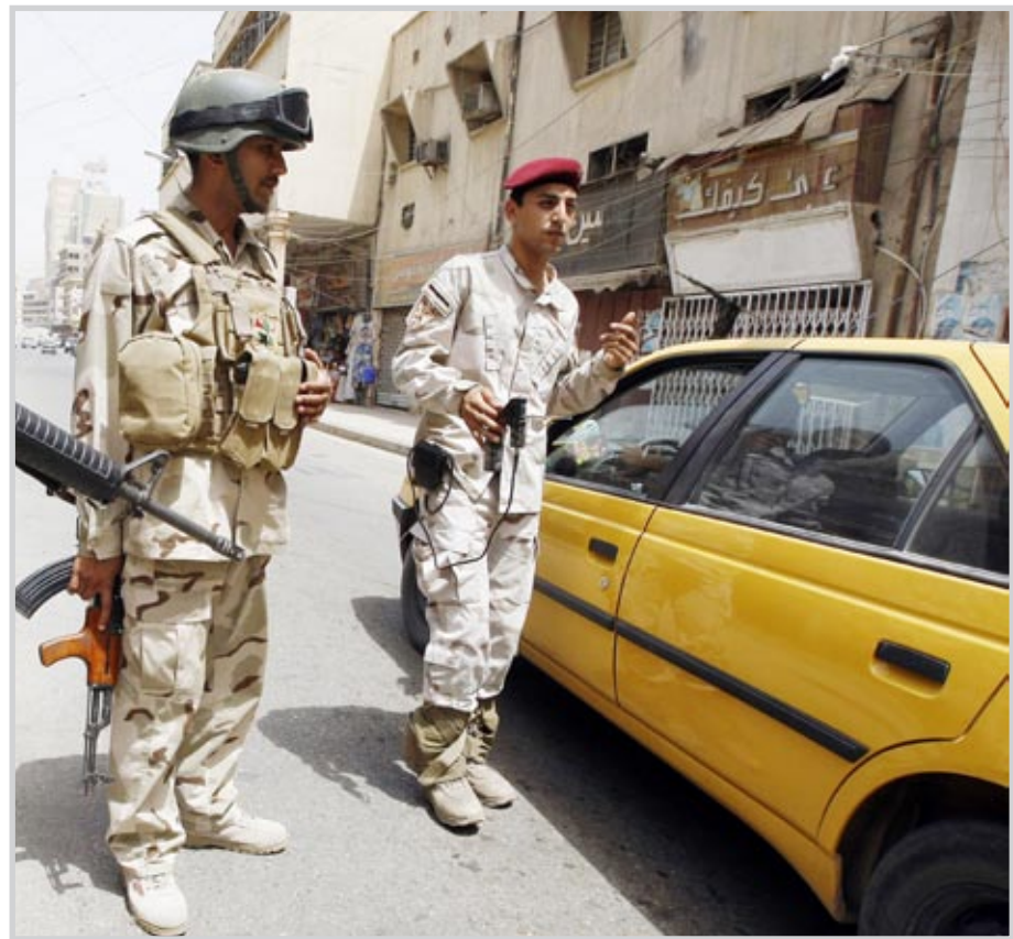
اجراءات أمنية مشددة عشية تظاهرات جمعة الحق

إحالتها إلى القضاء. وقال المصدر إن "محكمة الديوانية الجنائية أصدرت منذ ثلاثة أيام حكماً بالسجن لمدة سنة على عضو مجلس المحافظة وداد حاتم هاشم عن تيار الإصلاح الوطني الذي يتزعمه رئيس التحالف الوطني إبراهيم الجعفري"، مبيّناً أنها "أيدت بتزوير مستساكات رسمية قدمتها خلال ترشحا لانتخابات مجالس المحافظات، والتي فازت فيها".