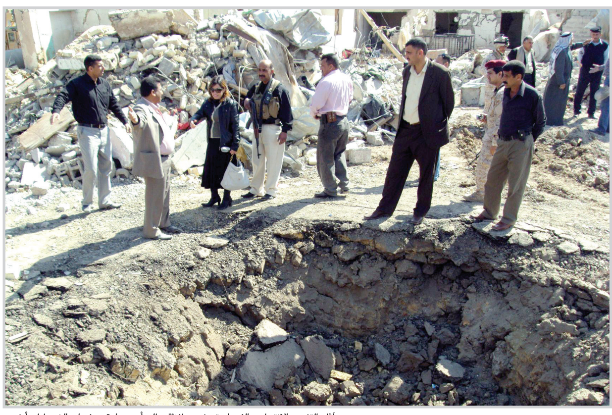
□ آثار التفجير الانتحاري الذي استهدف محافظة ديالى أمس وأوقع عشرات الضحايا..