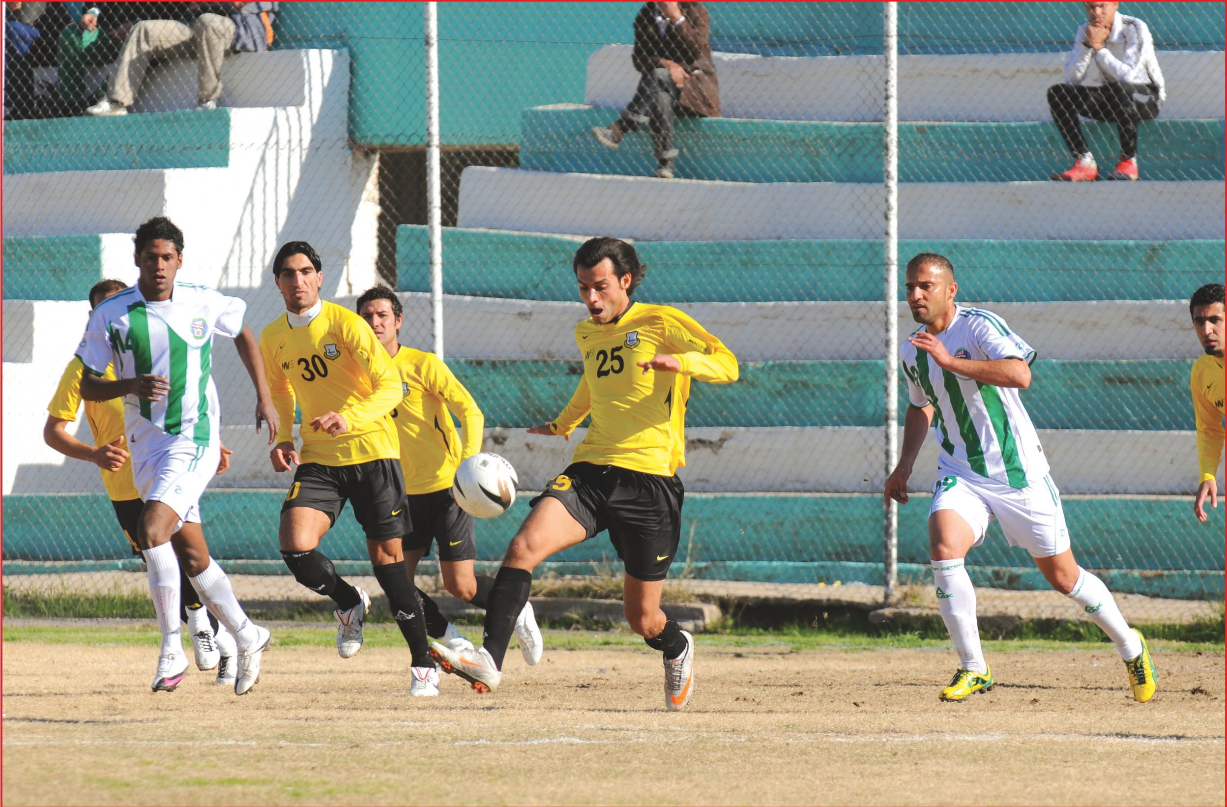
أربيل جاهز لتحقيق الفوز على الكرامة ..... تصوير أدهم يوسف

بأي تصريحات صحفية إلا بعد انتهاء المباراة. من جانب آخر استطلعت بعثة الاتحاد العراقي للصحافة الرياضية. جاهزية فريق دهبك وتابعت تدريباته التي جرت يوم امس الاثنين وتأكدت من جاهزيته لمباراة الغد حيث وصف سلمان مدرب نادي دهبك فرقه بأنه جاهز تماماً لتقديم عرض مشرف يليق ببطل دوري الموسم الماضي لكنه اعترف في ذات الوقت بصعوبة المباراة، مشيراً إلى ان فريق الفيصلي الاردني فريق متكامل له خبرة طويلة في البطولات الخارجية ويملك اسما مهمة لها مكانتها في الساحة الاردنية.