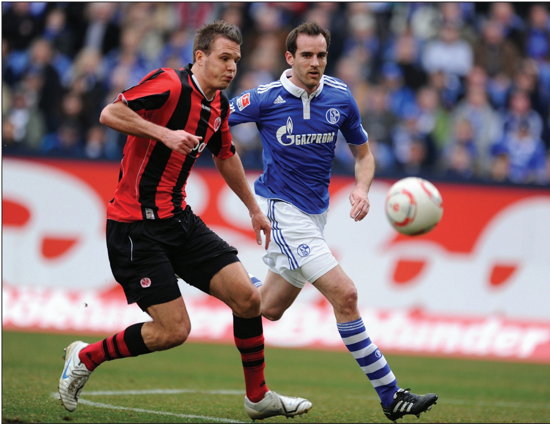
الدوري الألماني يدخل محطات الأثارة

الأندية التي ستبقى ضمن قائمة الأندية التي ستتواجد في منافسات هذا الموسم وهذا بعد ذاته دافعا لهذه الأندية من أجل وضع الحلول الخطلية والفنية التي تمتلك القدرة على لعب دور إيجابي في تحقيق نتائج جيدة تمنحها الفرصة الحقيقية للبقاء ضمن اندية (الصفوة) وعدم الدخول في حسابات الحقل والبيدر في نهاية الموسم الحالي!