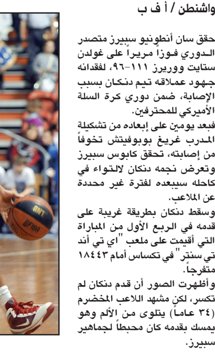
فوز وخسارة لسان انطونيو

الدوري فوزاً مرمياً على غولدن ستايت ووريزز ١١١-٩٦، لفقده جبهود عملاقه تيم دنكان بسبب الإصابة، ضمن دوري كرة السلة الأميركي للمحترفين. فبعد يومين على إبعاده من تشكيلة المدرب غريغ بوبوفيتش خوفاً من إصابته، تحقق كابوس سبيرز وتعرض نجمه دنكان لالتهاب في كاحله سببعه لفترة غير محددة عن الملعب. وسقط دنكان بطريقة غريبة على قدمه في الربع الأول من المباراة التي أقيمت على ملعب "اي تي أند تي سنتر" في تكساس أمام ١٨٤٤٣ متفرحاً. وأظهرت صور أن قدم دنكان لم تكسر، لكن منشور اللاعب المخضرم (٣٤ عاماً) يتلوى من الألم وهو يمسك بقدمه كان محيطاً لجهامير سبيرز.