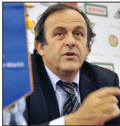
بلاتيني في منصبه باختيار جديد

والتعاب ينتج المباريات والتحكيم بخسة وحكام والشفاغية المالية وتطوير المنتخبات الوطنية. واعتبر بلاتيني أن لا مرشح مفضلاً لديه بين الرئيس الحالي للاتحاد الدولي السويسري جوزيف بلاتر ورئيس الاتحاد الآسيوي القطري محمد بن همام في الانتخابات الرئاسية المقبلة المقررة لرياسة (فيفا) في الأول من حزيران المقبل، مشيراً إلى أنه يتعين عليه مشاوره الدول الأوروبية قبل الإعلان عن قرار بهذا الصدد. وقال بلاتيني: "هناك مرشحان لرئاسة (فيفا)، وأنتم تسألوني لمن سيذهب صوتي، في السابق كنت مجرد ميشال بلاتيني ولم أكن أفكر سوى بنفسي، أما اليوم فانا رئيس الاتحاد الأوروبي، ويوجب علي التفكير ملياً، التحدث بالأمم مع مختلف الاتحادات الأوروبية لمعرفة رأيهم بالمرشحين، وبالتالي لم اعد أستطيع التكلم باسمي الشخصي".