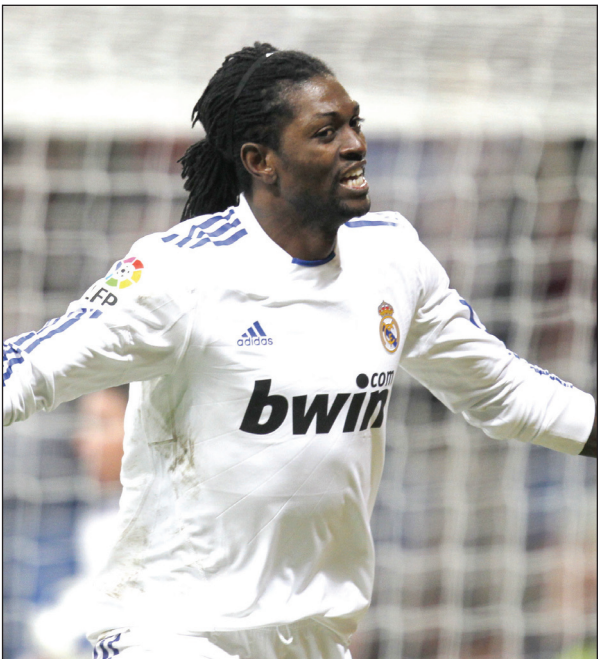
ألفيش باق مع البارشا

عاد مهاجم فريق ريال مدريد الإسباني ايمانويل اديبايور إلى صفوف منتخب توغو حيث من المقرر أن يشارك الأحد المقبل في المباراة المقررة ضد سالواوي في ليلونغوي ضمن الجولة السابعة من تصفيات المجموعة الحادية عشرة من التصفيات المؤهلة إلى كأس أمم أفريقيا ٢٠١٢، وجاء استدعاء اديبايور لينضم إلى تشكيلة ١٦ لاعبا محترفا. وكان اديبايور قرر اعتزال اللعب دوليا بعد الهجوم الذي تعرض له وقد المنتخب التوغولي في منطقة كابيندا في ٨ كانون الثاني ٢٠١٠ عشية نهائيات كأس الأمم الأفريقية الذي أدى إلى مقتل اثنين من أعضاء الوفد. وقال اديبايور: «لا زلت متأثرا بأحداث ذلك الاعتداء الذي كنت شاهدا على ما حصل خلاله للحافلة التي كانت تنقل منتخب توغو».