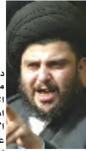
دان السيد مقتدى الصدر امس الاثنين، على لسان حسيد الناظرين باسمه. خطف ١٨ من عناصر الحرس الوطني العراقي ودعا خاطفيهم الى الافراج عنهم (فورا). وقال الشيخ حسن الزرقاني مسؤول

العلاقات الخارجية في مكتب الشهيد الصدر في بيروت لقناة (الجزيرة) القطرية ان مقتدى الصدر (يناشد هؤلاء المتطافين مع تيار الشهيد الصدر ومع سماحة السيد حازم الاعرجي ان يتوقفوا عن هذا العمل ويباشروا فوراً بإطلاق سراح أولئك المعتقلين). وكانت مجموعة مسلحة تطلق على نفسها اسم (كتائب محمد بن عبد الله) اكدت في شريط فيديو الاحد، وفق ما ذكرت اسرتهما. وأضاف الشيخ الزرقاني ان (اسلوب الخطف مرهق وضار تماماً. نحن لا نستخدم الوسائل التي استخدمها الولايات المتحدة ولا الشرطة والحكومة العراقية في اعتقال الأشخاص). وتابع ان (اسلوب الخطف ليس أسلوبنا (...). نؤكد رفضنا التام لعملية قتل هؤلاء الأشخاص من الحرس الوطني العراقي فجر