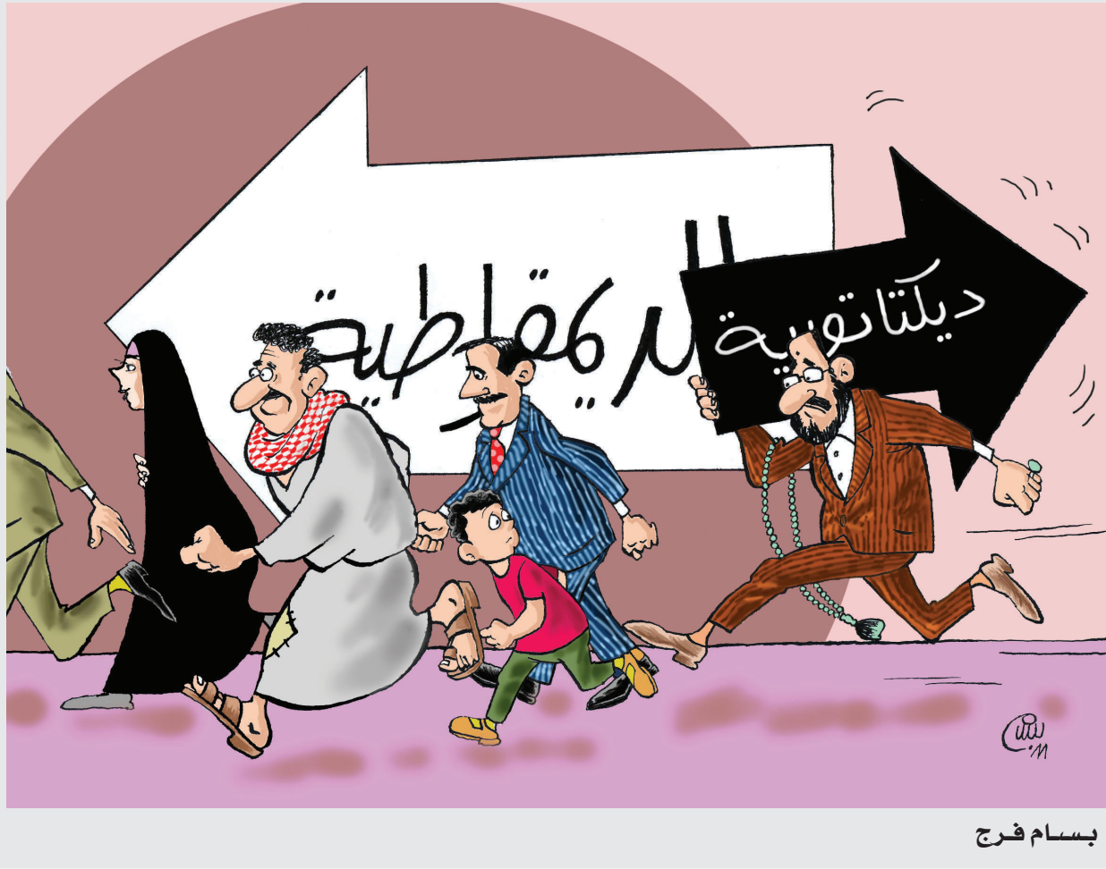
كاركاتير بسام فرج