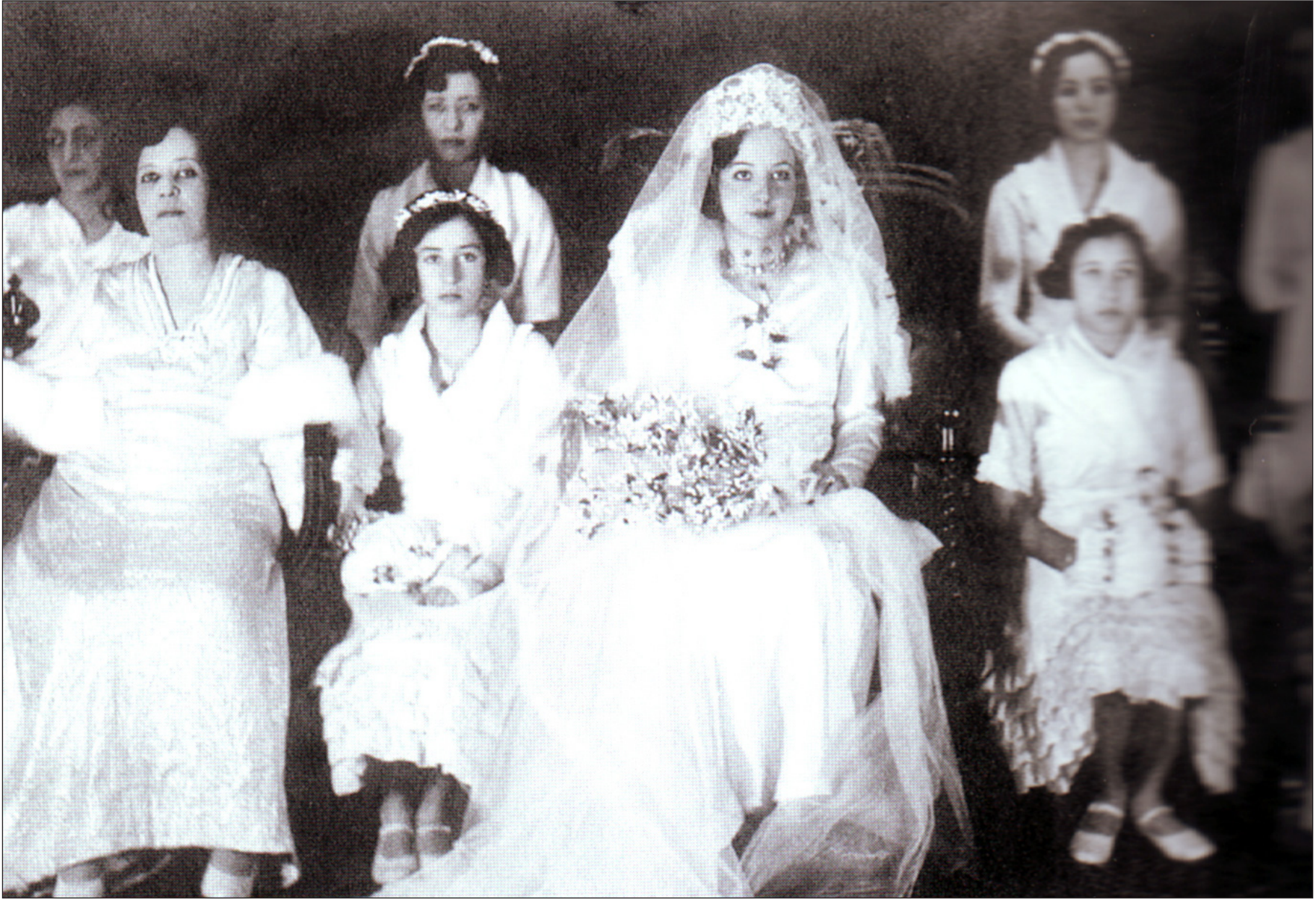
زفاف الملكة عالية

ورئيس مجلس النواب مراعاة للحداد وحضر الملك عبد الله حفلة القران هذه واقصرت على تناول طعام العشاء على المائدة الملكية. وانتقلت الملكة عالية الى بيتها الجديد (قصر الزهور) وفيه أخذت تتلقى دروسا في العلوم والآداب على مدرسين ومدرسات ممتازين. والحقيقة التي لا جدال فيها ان الملك غازي لو تزوج ابنة ياسين الهاشمي (نعمت) لتغير تاريخ العراق وسارت البلاد في غير الاتجاه التي سارت عليه فيما بعد، وفي تاريخ العالم كثير من الأمثلة على ان زواج الملوك يغير مجرى تاريخ أوطانهم التي يحكمونها فقد تسعد وقد تشقى نتيجة ذلك. ويروي لنا توفيق السويدي جانبا من الأحاديث التي دارت بينه وبين الدوتشي موسوليني في شهر ايار ١٩٣٤ بخصوص زواج الملك