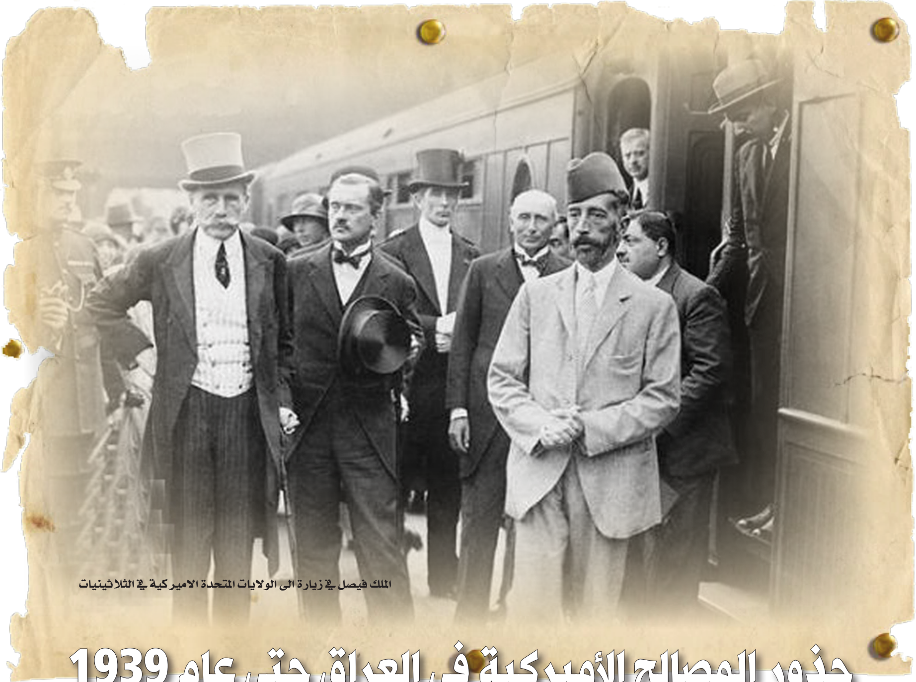
الملك فيصل في زيارة إلى الولايات المتحدة الاميركية في الثلاثينيات