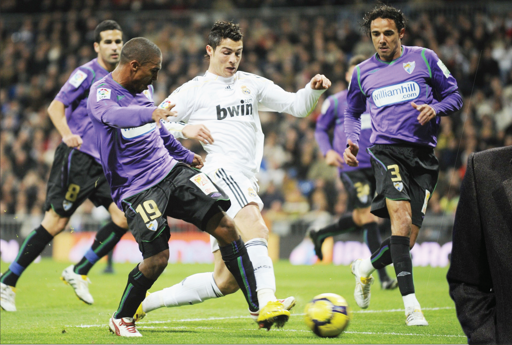
رونالدو يستعد للمشاركة مع الريال امام توتنهام

الملايين التي يحصل عليها ، لقد أخبرته أن عمله الشاق ومثابرتيه سيجعلان منه لاعباً رائعاً ، لقد تطور منذ ذلك الحين وبدأت الثقة تعود إليه من جديد . وتردد حين تعاهد النادي الملكي مع اديبايور لتعويض غياب النجم الأرجنتيني المصاب غوزالو هيوغين ، أن ذلك سيؤثر نفسياً على بنزيمة وأن منافسه التوغولي من دون شك سيصبح المهاجم الأساسي للفريق ، ولكن بنزيمة خالف التوقعات وأصبح لاعباً لا غنى عنه في ريال مدريد. وأوضح مورينيو : لقد تعاقدنا مع اديبايور لأننا نحتاج إليه ، وليس لتصعيب الأمور على بنزيمة ، ولكنه أتى بخماره في كل مرة أضع به من على مقاعد البدلاء ، كريم لم يعد طفلاً رائعاً ، إنه رجل ، وبإمكانه اللعب في أي مكان ، أحب هذه النوعية من اللاعبين .