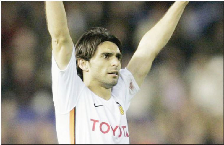
أيالا يهاجم مارادونا

مع المنتخب الأرجنتيني على مدار مسيرته الكروية، إلى المباراة الودية التي جرت بين الفريقين قبل فترة قصيرة من مونديال ٢٠١٠ وحقق خلالها المنتخب الأرجنتيني الفوز