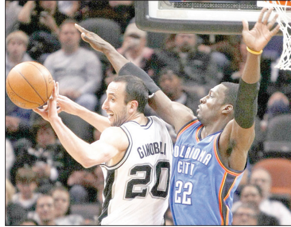
جانب من لقاء أوكلاهوما وبورتلاند

لحق أوكلاهوما سيتي ثاندن بركب المتأهلين إلى الـ "بلادي أوف" من دوري كرة السلة الأمريكي للمحترفين بتغلبه على ضيفه بورتلاند ترايل بلايزرز ٩٩-٩٠ نقطة. وهي المرة الثانية على التوالي التي يبلغ فيها أوكلاهوما سيتي ثاندن الـ (بلادي أوف) في موسمه الثالث في الدوري الأمريكي للمحترفين وتحديداً منذ عام ٢٠٠٨ عندما تحول اسم الفريق من سياتل سوبر سونيكس إلى أوكلاهوما سيتي ثاندن وانتقل الفريق إلى اللعب في أوكلاهوما وذلك بعدما قرر مالكه كلاي بينيت أن يعود به إلى مسقط رأسه. وهو الفوز رقم ٤٨ لأوكلاهوما سيتي ثاندن في ٧٢ مباراة حتى الآن وهو يدين به إلى راسل ويستبروك صاحب ٢٨ نقطة بينها