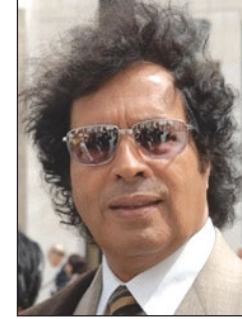
أحمد قذاف الدم

القذافي نتيجة انفضاض الجمع من حوله. لم تكن استقالة وزير الداخلية الليبي عبد الفتاح العبيدي، هي فاتحة الاستقالات، بل سبقه وزير حل مكان عبد الرحمن شلقم الصديق الأقرب إلى القذافي الذي انشق عنه منذ بداية الأحداث في شباط الماضي.