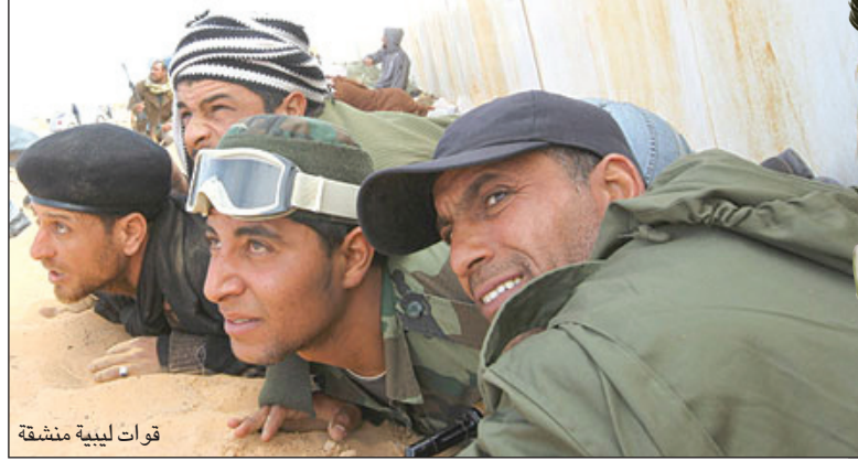
قوات ليبية منشقة

وتضيق الدائرة لتطال القذائف أنفسهم، حيث وقف عدد من قيادات قبيلة القذائف في مدينة بنغازي إلى جانب الثوار، فيما دعا الوالي السابق لقبيلة أولاد سليمان، وهي ترتبط برابطة نسب مع قبيلة