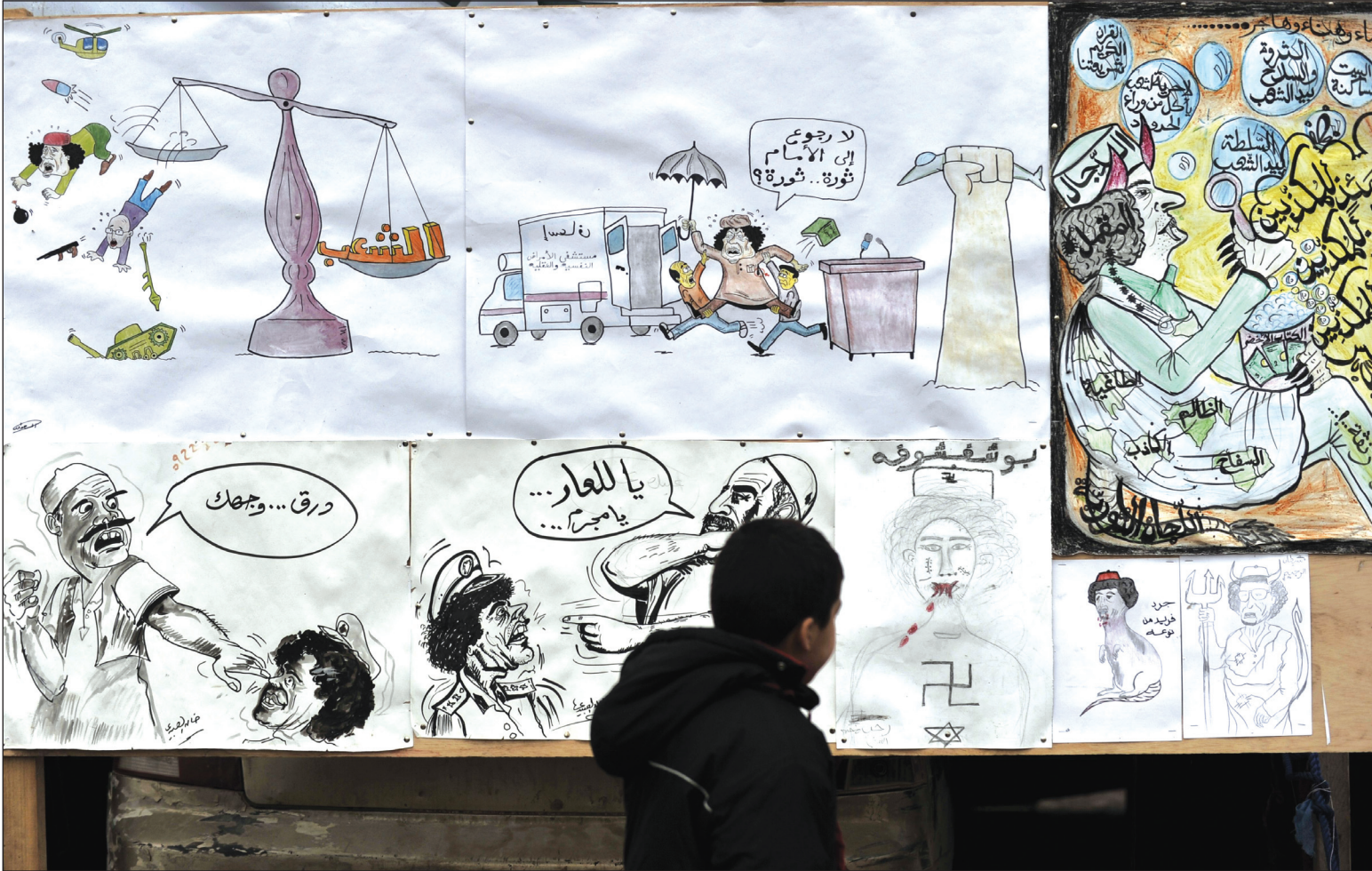
معرض للرسوم الكاريكاتيرية يسخر من القذافي أقيم في شوارع مدينة بنغازي الليبية..... أ.ف.ب

تصاعد وتيرة كل شهر، بينما تتباين المواقف بين مطالب بالاستمرار في البرنامج الاحتجاجي، وبين داع إلى منح الدولة مهلة لتحقيق لألحة المطالب الواردة في أرضية الحركة الشبانية، لأنه يصعب تنفيذها في ظرف زمني ضيق. وتميزت المذكرات المقدمة من طرف الأحزاب باختلاف المواقف من الفصل ١٩، أو ما يوصف بـ "الفصل السحري"، الذي يعطي صلاحيات واسعة للملك، إزاء فيه الملك أمير المؤمنين، والممثل الأسمى للأمة، ورمز وحدتها، وضامن دوام الدولة واستمرارها، وهو حامى حمى الدين والساهر على احترام الدستور، وله صيانة حقوق وحرية المواطنين والجماعات والهيئات، وهو الضامن لاستقلال البلاد وحرورة المملكة في دائرة حدودها الحقة". فقيما طالبت مكونات سياسية بإدخال تعديلات على هذا الفصل من الدستور، أشارت أخرى إلى ضرورة الحفاظ عليه كما هو. ويؤكد قيادون سياسيون على أن البناء الديمقراطي يتطلب المزيد من الإصلاحات الإضافية، إلى جانب الدستور، تحد من تدخل السلطة والمال في صناعة القرار السياسي. يشار إلى أن شباب "حركة ٢٠ فبراير" يسخرون التكنولوجيا الحديثة في تغطية تظاهراتهم الاحتجاجية، فيألي جانب اعتماد كاميرات والآلات تصوير، أخذوا في المواقع الاجتماعية مجموعات خاصة بنقل آخر مستجدات الحركة، كما أنهم لجأوا، اليوم، إلى النقل المباشر للمسيرة. وينتقد شباب الحركة بشدة الإعلام العمومي، ويطالبون برحيل مجموعة من الأسماء، التي تُشرف على تسيير هذه المنابر، التي تصاعدت فيها، هي أيضا، الأصوات المطالبة بـ "دمقرطة الإعلام العمومي".