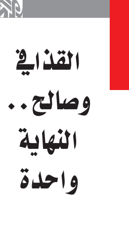
القذافي وصالح.. النهاية واحدة

ثمة الكثير من أوجه الشبه، والقليل من الاختلافات بين دكتاتوري اليمن وليبيا، فكلاهما انقلابي قفز إلى السلطة على ظهر دبابه، فتمسك بها حتى الموت، وحتى ما بعد الموت، من خلال فكرة التوريث، وصالح أعد ابنه لقيادة اليمن وسلمه قيادة الحرس الجمهوري، وهو يؤمن أن القوة مع قليل من التامر كافية ليحتل الابن مكان أبيه، والقذافي وزع المسؤوليات بين الأبناء ليضمن أن يظل هو الأقوى، ثم ليتنازعا "باخوة" بعده، وهو واثق أنه لا يوجد من هو أقوى منهم في ليبيا، أو أقدر على الغفر إلى مرتبة الزعيم. ولد القذافي في قرية تسمى جهنم، والتحرق بالجيش وهو يحمل فكرة الإنقلاب، وما أن حمل رتبة ملازم حتى قاد انقلاباً مشبوهاً رفعه إلى