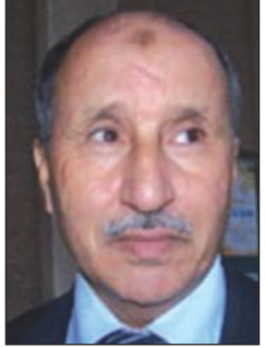
مصطفى عبد الجليل