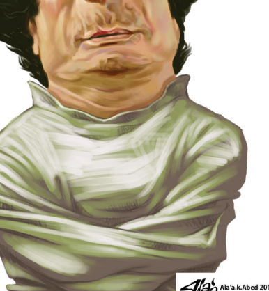
أحمد قذاف الدم

ففيما أعلنت واشنطن أن انشقاق وزير الخارجية موسى كوسا، يظهر أن نظام القذافي يتداعى، كانت إشارات عديدة منذ بداية الثورة تبين بوضوح الأضرار السلبية التي سبعا منها