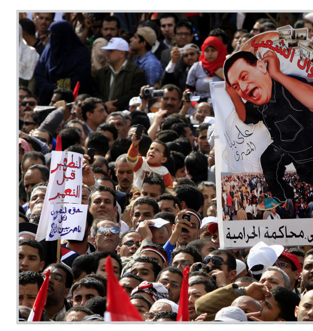
عاجل ناخرنا في محاكمة الجرامية

وقال المجلس الأعلى للقوات المسلحة إن الانتخابات التشريعية ستجرى في سبتمبر أيلول بينما ستجرى انتخابات الرئاسة قبل نهاية العام وأنه إلى ذلك الوقت سيظل يدير شؤون البلاد. وأحرق متظاهرون علم إسرائيل وهتف متظاهر عبر مكبر للصوت ع القدس رايعين شهداء بالملايين" ورد مئات المتظاهرين وراءه. وفي مدينة الإسكندرية الساحلية خرج عشرات الآلاف من النشطاء إلى الشوارع بعد صلاة الجمعة مطالبين بالإسراع بمحاكمة مبارك وكبار مساعديه. ورد متظاهرون هتافا يقول "يا طنطاوي خذ شرارك يا (أو) تتحكم زي مبارك و"شهد شهداء يا تاريخ هنجيبهم من شرم الشيخ" في إشارة إلى مبارك وأفراد أسرته. واستغل نشطاء وجود الحشود في توزيع بيانات تدعو للعضوية في أحزاب تتأسس حاليا.