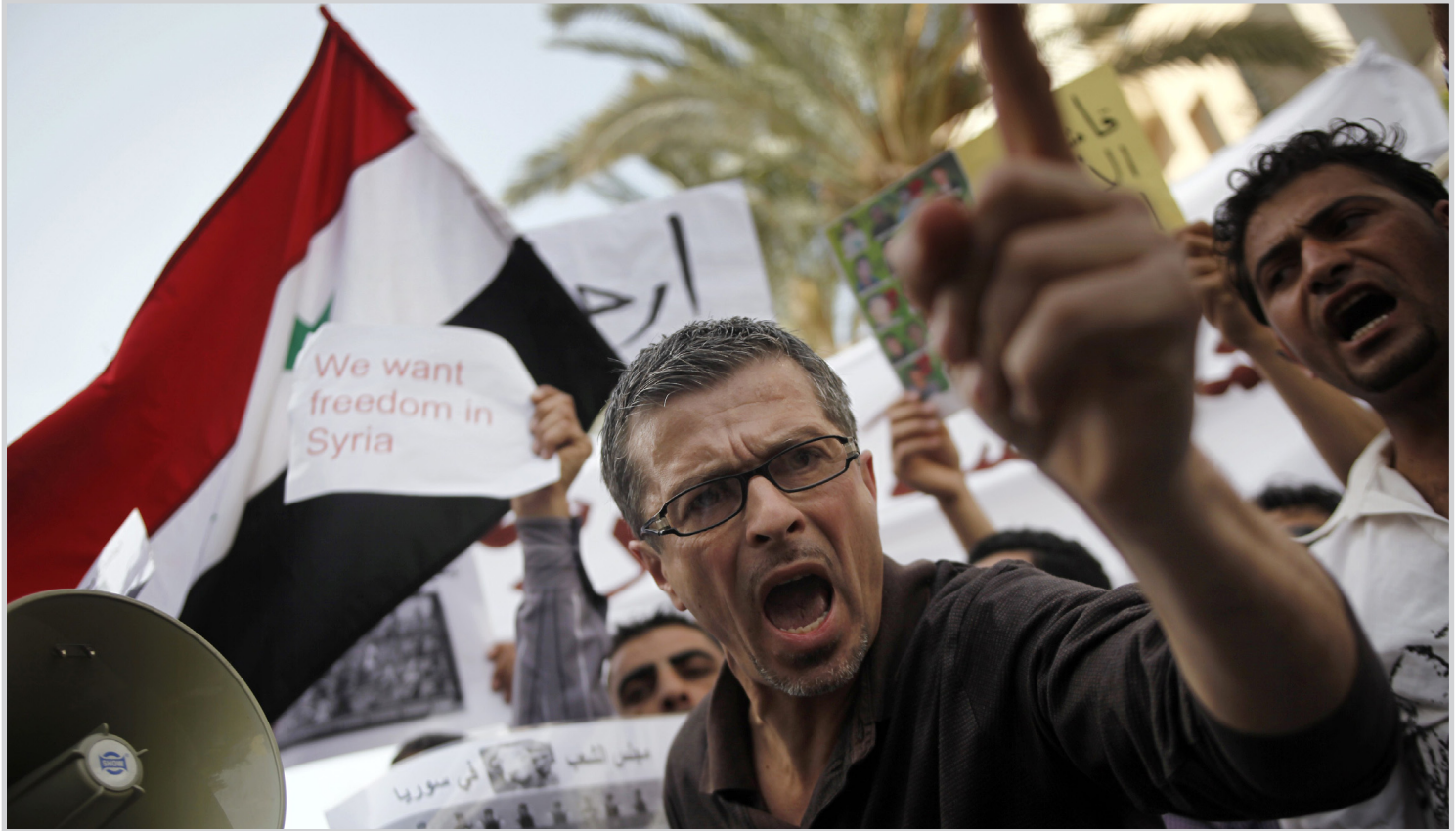
تظاهرات واحتجاجات في المدن السورية

وقال حسن كامل القيادي في الحزب الديمقراطي الكردي إن الخطوة التي أقدم عليها الأسد غدت التظاهرات التي تشهدها المناطق الكردية، مضيفا أن قضيتهم هي "الديمقراطية والحرية والهوية الثقافية".