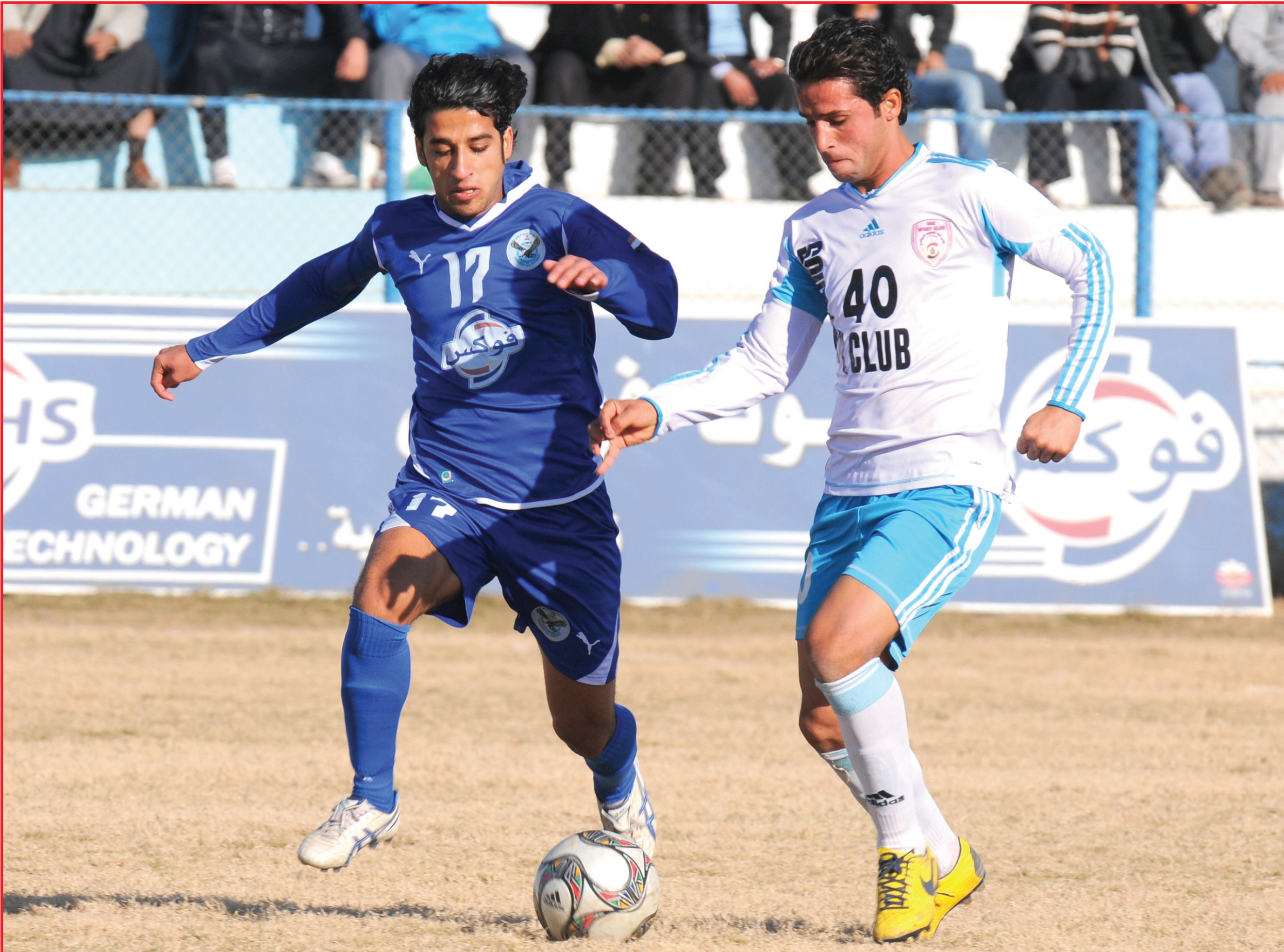
الجوية يواجه بغداد ويسعى الى تقليص الفارق مع الزوراء...

مباراتان الاولى بين البيشمركة وسامراء والثانية تجمع الكهرباء والنقط. وتجري الخلاصة المقبل ثلاث مباريات ضمن المجموعة ذاتها يلتقي فيها ديالى مع زاخو والرمادي أمام الصناعة والجيش بمواجهة الشرطة ، فيما تأجلت مباراتنا الموصل وأربيل والكرخ ودهوك لمشاركة حامل اللقب وجاره في منافسات بطولة كأس الاتحاد الآسيوي في جولتها الثالثة من الدور الأول حيث يواجه أربيل ضيفه العروبة اللبناني ويحل دهبك ضيفا على الجيش السوري في ملعب العباسيين.