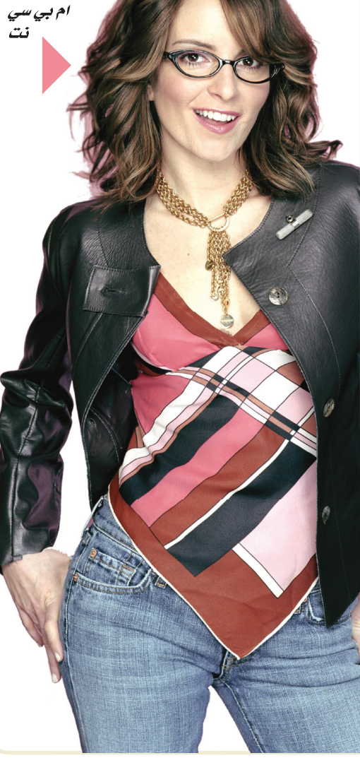
ام بي بي نت

لندن الطفل الثاني في العائلة لديه إمكانية أكبر للنجاح في الحياة، وذلك نتيجة شعوره بالرغبة بمناقسة أخيه أو أخته الأكبر منه. هذا ما يقوله باحثون بريطانيون في جامعة كمبريدج، وجدوا أن الأولاد الذين يتشاجرون مع اخوتهم الأكبر منهم قد ينجحون أكثر في حياتهم، مشيرين إلى أن الشجار بين الأشقاء والشقيقات يزيد المهارات الاجتماعية والقدرة على التعبير والنمو. وقالت الطبيبة كلير هيوز من كلية نيونهام في كمبريدج "حين