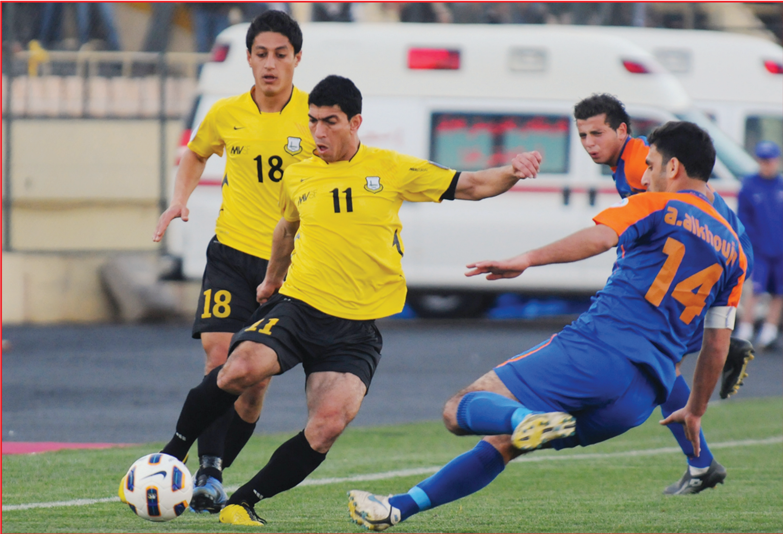
أربيل يسعى لحسم الشراكة مع العربوية العماني..