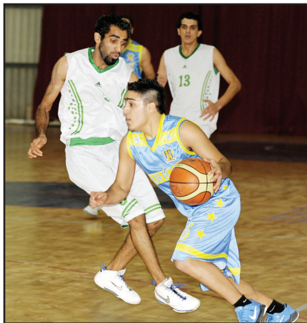
بغداد / المدى الرياضي