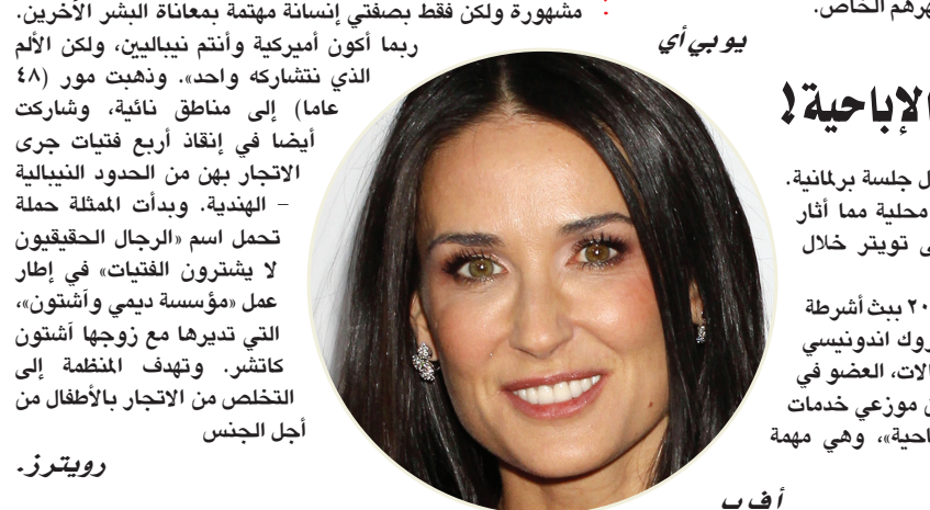
يوي بي سي

تشير إلى أن الإناث يهتمن بمظهرهن أكثر من الذكور. واعتبرت زبريفين أن الإعلام قد يكون له دور في الدرجة المتزايدة لاهتمام الرجال بمظهرهم. وتبين أن للإعلام دوراً أيضاً في زيادة تركيز الأشخاص على مظاهر شركائهم. وقالت زبريفين انه تبين أن الرجال يبدون أقل رضا عن علاقاتهم الجنسية في حال التركيز على مظهر الشريكة أو مظهرهم الخاص.