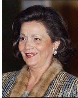
زوجة الرئيس السابق محمد حسني مبارك المجلس بهذا الحساب من قبل وعدم إضافته لوديعة المكتبة.

وشدد البيان على "ضرورة استرجاع الأموال الموجودة بالحساب وإضافتها للوديعة عقب انتهاء التحقيقات بعد ان كان أعلن عن وجوده بالبنك الأهلي المصري-فرع رئاسة الجمهورية.