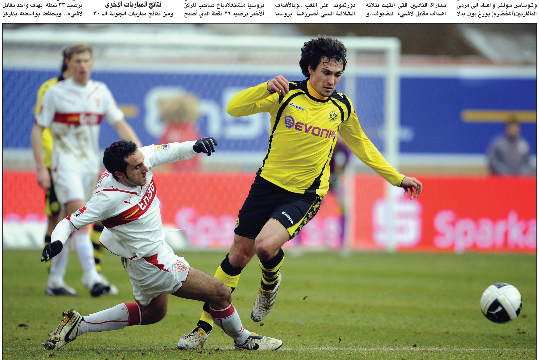
دورتموند يواصل ميسرته نحو الظفر باللعب

التاسع برصيد ٤٠ نقطة متقدما بفارق الأهداف على نادي شالكه الذي عاد من بريمن بتعادل ايجابي ١-١ أمام نادي فيردر بريمن ..صاحب المركز الحادي عشر برصيد ٣٥ نقطة وانتهت مباراة هانوفر رابع الثلاثة برصيد ٥٤ نقطة وبفارق نقطتين عن بايرن ميونيخ.. وهامبورغ صاحب المركز السابع برصيد ٤٣ نقطة..انتهت بالتعادل السلبي صفر- صفر وعاد نورنبرغ من كيزرسلاترن بثلاث نقاط (ذهبية) رفعت رصيده الى ٤٦ نقطة ومنحته فرصة التمسك بالمركز السادس وذلك من خلال فوزه على صاحب الارض والجمهور سلاووترن الذي تراجع الى المركز الثالث عشر برصيد ٤٣ نقطة..بهدفين مقابل لاشيء وأصبح موقف نادي فولفسبورغ صعبا جدا بعد تعادله على أرضه وامام جمهوره ٢-٢ امام سانت باولي صاحب المركز قبل الأخير برصيد ٢٩ نقطة والذي يتخلف عن فولفسبورغ صاحب المركز السادس عشر بفارق الأهداف ويهذه النتيجة أصبح هذان الناديان مرشحان قويان للهبوط الى دوري المظالم مع نادي بروسيا منشغلادياخ.