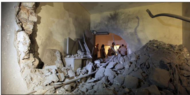
صور لآثار الدمار الذي لحقته الغارة على بيت القذافي

تقرر أمس إلغاء جواز سفر الرئيس المخلوع حسني مبارك الذي يحمل رقم (١) تحت اسم (محمد حسني السيد مبارك) ومهنته رئيس جمهورية مصر العربية، وذلك انتظارا لرئيس جديد يحمل هذا الجواز. وقال مصدر مسؤول بمطار القاهرة إنه تم إلغاء ٩٨ جوازاً دبلوماسياً (أحمر) لشخصيات عديدة أبرزهم جمال مبارك الذي يحمل جواز رقم (١٦) وشقيقه علاء ووالده سوزان مبارك وعاطف عبيد وأحمد نظيف رئيسا الوزراء الأسبقان وأحمد المغربي وزير الإسكان السابق ود. فتحي سرور رئيس مجلس الشعب السابق وصفوت الشريف رئيس مجلس الشورى السابق، ود. زكريا عزمي رئيس ديوان رئيس الجمهورية السابق وحبيب العدالي وزير الداخلية الأسبق وأنس العفي وزير الإعلام السابق. وأضاف المصدر إنه تم إلغاء كل الجوازات الدبلوماسية الخاصة بأسرة الرئيس السابق وجميع الوزراء السابقين الخاضعين للتحقيقات أمام الكسب غير المشروع، بالإضافة إلى جميع الوزراء السابقين الذين لم تشملهم التحقيقات. كما تقرر إلغاء ٧٠٠ جواز (خاص) تحمل اللون الأزرق والخاصة بأعضاء مجلسي الشعب والشورى (المنحلين)، لأنها تمنح لهم الصفة البرلمانية وليست الشخصية. وأكد المصدر أن ١٢٠ نائباً برلمانياً سابقاً رفضوا تسليم جوازاتهم (الخاصة) ولذلك تقرر إلغاؤها.