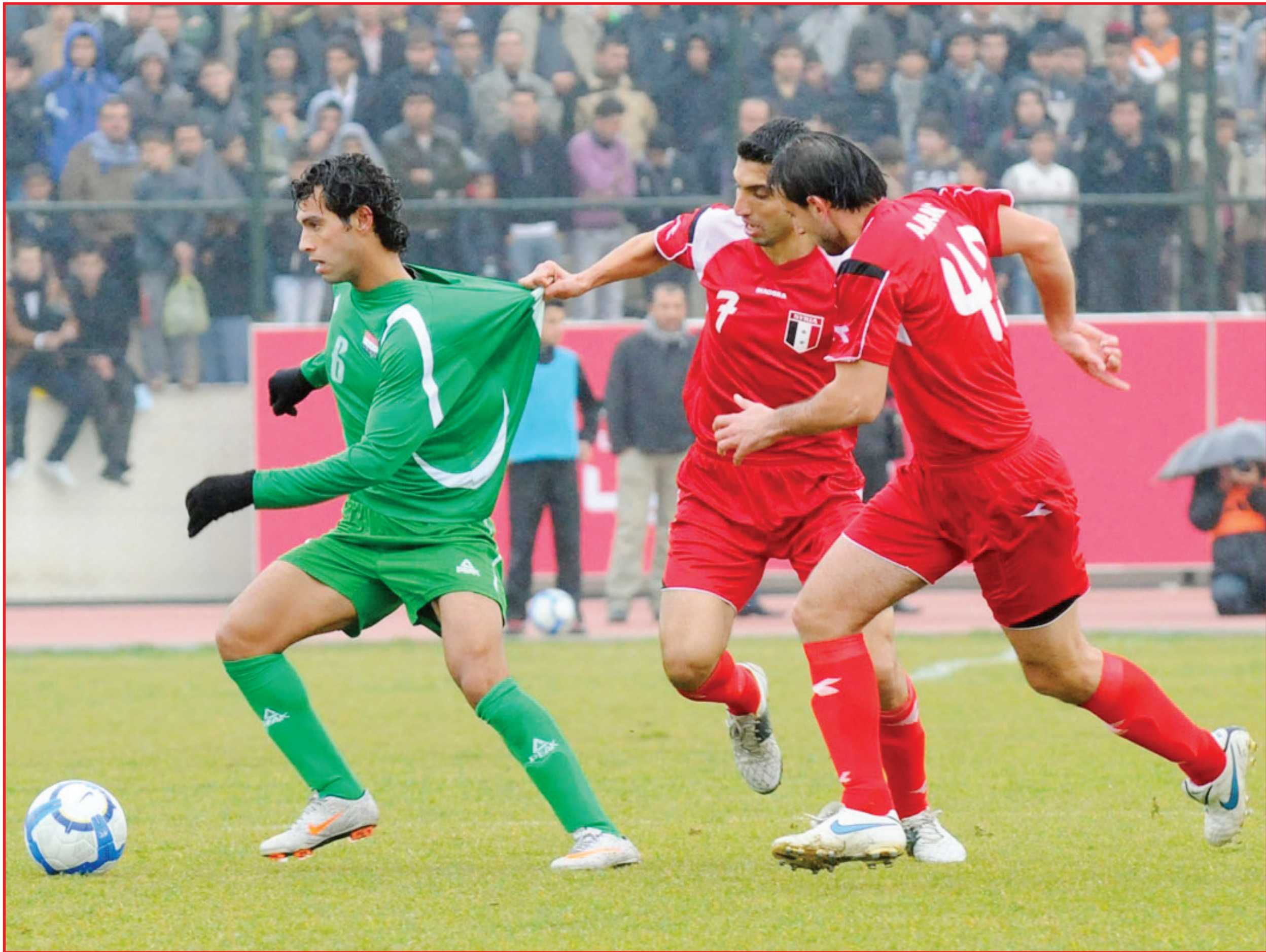
فيفا يواصل الحظر على مباريات العراق الدولية في بغداد ...

واضاف المصدر : ان الاتحاد الدولي طلب من العراق الاستمرار في إقامة مباريات منتخباته واندبته في مدينة أربيل في إقليم كردستان بموجب الحظر الدولي المفروض عليه عام ١٩٩٠ .