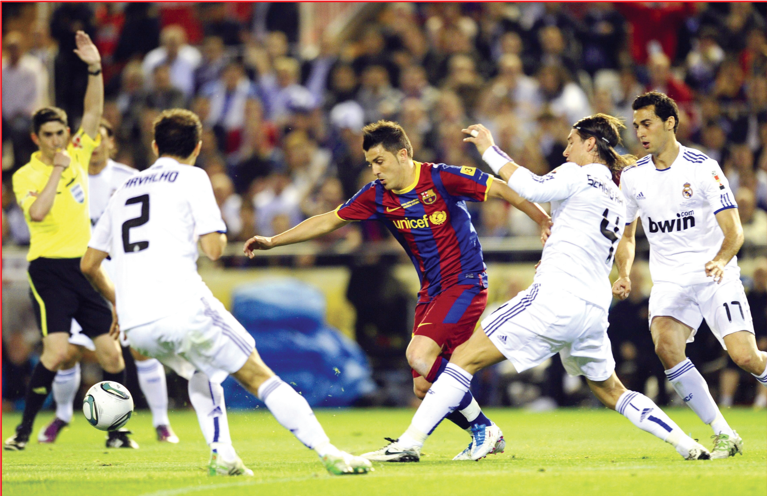
كاتب نو يشهد اليوم موقعة حامية الوطيس بين برشلونة وريال مدريد