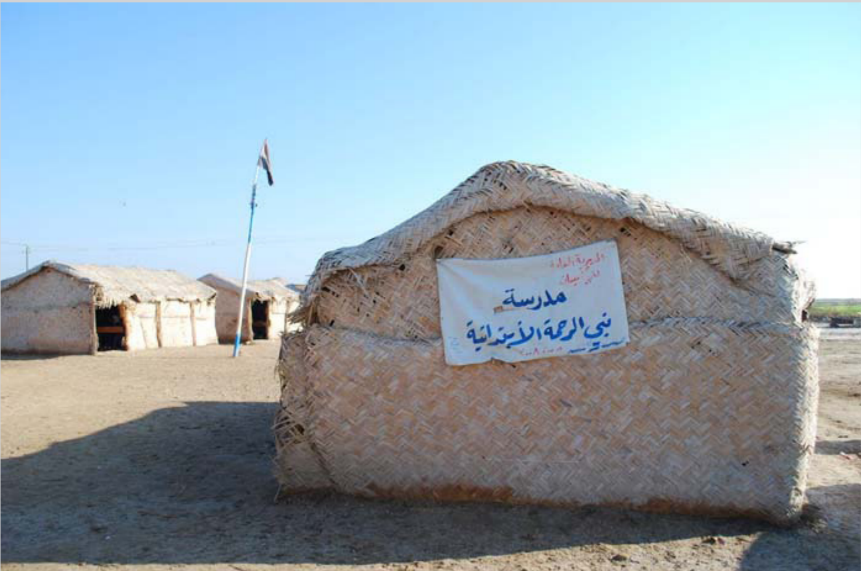
نموذج مدرسة عراقية رغم الملايين التي خصصت لوزارة التربية