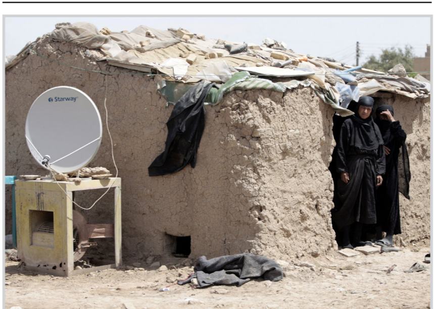
من نتائج الفساد المالي

تقارير : رغم أن العراق يحتوي على ثاني أكبر احتياطي في العالم، ويصدر أكثر من ٢,٢ مليون برميل يوميا من النفط، وتزيد موارثته للعام الحالي على ٨٢ مليار دولار فإن أكثر من ٢٢٪ من سكانه يعيشون تحت خط الفقر و٤٠,٥٪ بمستوى الفقر المدقع، وأكثر من نصف سكانه عاطلون عن العمل، وتقس التسليح تقريبا من مواطنيه يعانوا الامية.