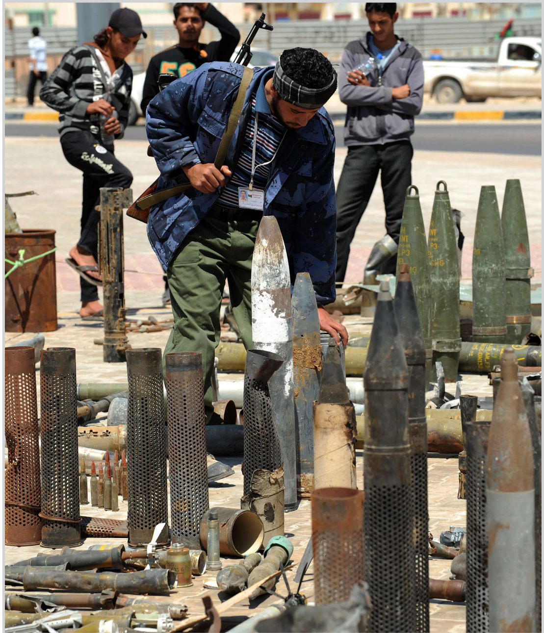
ثوار ليبيا يستولون على أسلحة كتائب القذافي

وقالت المنظمة إن التقرير أعد بناء على زيارة لمصراتة من ١٤ إلى ٢٠ أبريل/نيسان الماضي ومقابلات مع سكان تم إجلاؤهم. من جانبهم قال الثوار إن قوات القذافي قامت بتلقيم ميناء المدينة المحاصرة وتسميم الخزانات التي تمدها بالمياه. سياسيا استبعد رئيس المجلس الوطني الانتقالي مصطفى عبد الجليل لجوء القوات الدولية إلى عمليات