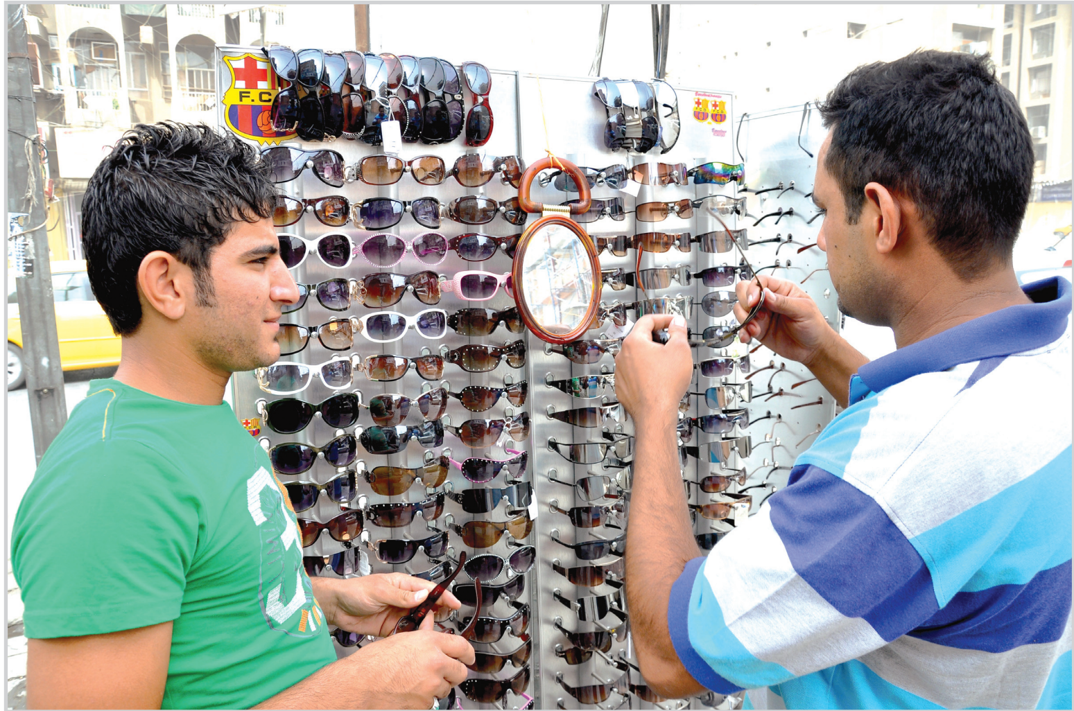
شابان يتبضعان من بائع عدسات واقية من الشمس في بغداد..