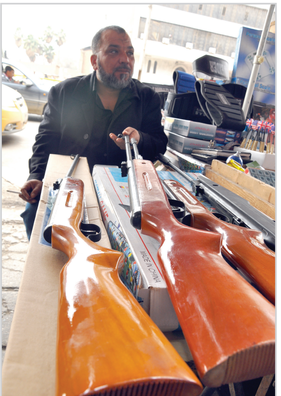
عراقي يبيع أسلحة للصيد وسط بغداد أمس..

أهالي الفارين والعالمين في السجون المعنية. وكان رئيس مجلس النواب أسامة الجبفي، قد كشف الخميس الماضي، عن تورط جهات متنفذة في عملية هروب المعتقلين من سجن البصرة. ينكر أن اللجنة البرلمانية التي شكلت في الـ ٢١ من شباط الماضي، للتحقيق بشأن هروب سجناء البصرة، أكدت بان عملية هروب السجناء تمت بمساعدة أحد ضباط السجن حسب التحقيقات، مبيحة أن إقالة قائد شرطة المحافظة لا يمت بصلة للموضوع. إلى ذلك، نفى اختلاف دولة القانون تورط مكتب القائد العام للقوات المسلحة، بعملية هروب معتقلين من