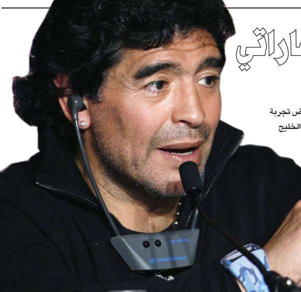
ماردونا يخوض تجربة جديدة في الخليج

وعداد بوروسيا فيرمينو (٤٩) وأنهى سانت باولي الذي هبط إلى الدرجة الثانية في المرحلة الماضية، موسمه في الأولى بخسارة أمام ماينتس بهدف ماتياس ليتمان (٤٢) مقابل هدفين لاندري شوروله (٥٨) من ركلة جزاء والتونسي سامي العلاقي (٨٢). وضمن ماينتس مشاركتهم في مسابقة السدوري الأوروبي «يوربوا ليغ» الموسم المقبل إلى جانب هانوفر الفائز على نورمبرغ بثلاثة أهداف للدولي التونسي كريم حقي (٣٠) وقسطنطين راوش (٦٠) والعاجي نديديه يا كونان (٧٨) من ركلة جزاء) مقابل هدف لجوليان فيسماير (٢٥).