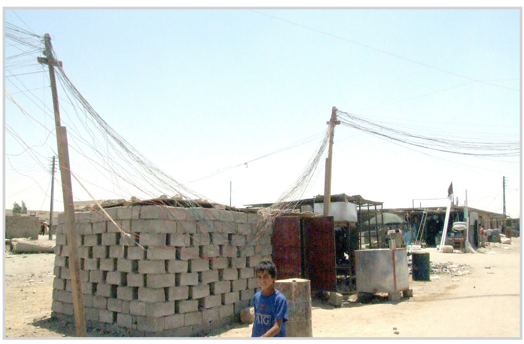
مولدة كهربائية في احد احياء بغداد

المولدات لم ولن يلتزموا بالاسعار التي حددت ل"الامبير"، كما انهم "المواطنون سئموا الشكوى وياسوا من رفع اصواتهم مطالبين بتخفيض اسعار الامبيرات، فيما يستمر صاحب المولدة باسعاره الخاصة دون رادع. وكان قد اعترض عدد من الاهالي على اصحاب المولدات الاهلية لرفعهم الاسعار، معتمدين على ان الحكومة حددت سعر الامبير بـ (٥) الاف، بينما تأتي اجابة "اهل المولدات" باللامبالاة والتهديد بان من لا يرضى بالاسعار يسحب وايره".