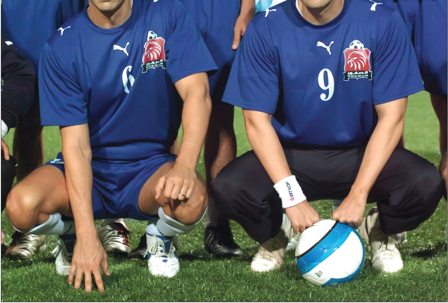
جمال وعلاء مبارك.. صورة من أيام العز .....

دمشق/ أ.ف.ب لا تزال دمشق، نسيباً، بمنأى عن الحركة الاحتجاجية ضد نظام الرئيس بشار الأسد، إلا أن القلق حول تطور الأوضاع في بقية أرجاء البلاد بدأ يشق طريقه إلى قلوب سكان العاصمة السورية. وفي شوارع العاصمة وطرقاتها العامة لا تزال الاختناقات المرورية والإرصفة المزدحمة على عاداتها، إلا أن العديد من المناسبات الثقافية الغيت أو قدم موعدها لكي لا يضطر مرتادوها للعودة إلى بيوتهم في وقت متأخر. وقال أحد السكان الذي يعتبر نفسه من الموالين للنظام "قبل أسبوعين كنا ما زال نصدق تأكيدات الحكومة بأن الوضع تحدد من السيطرة، وإن الأزمة قد انتهت". وأضاف