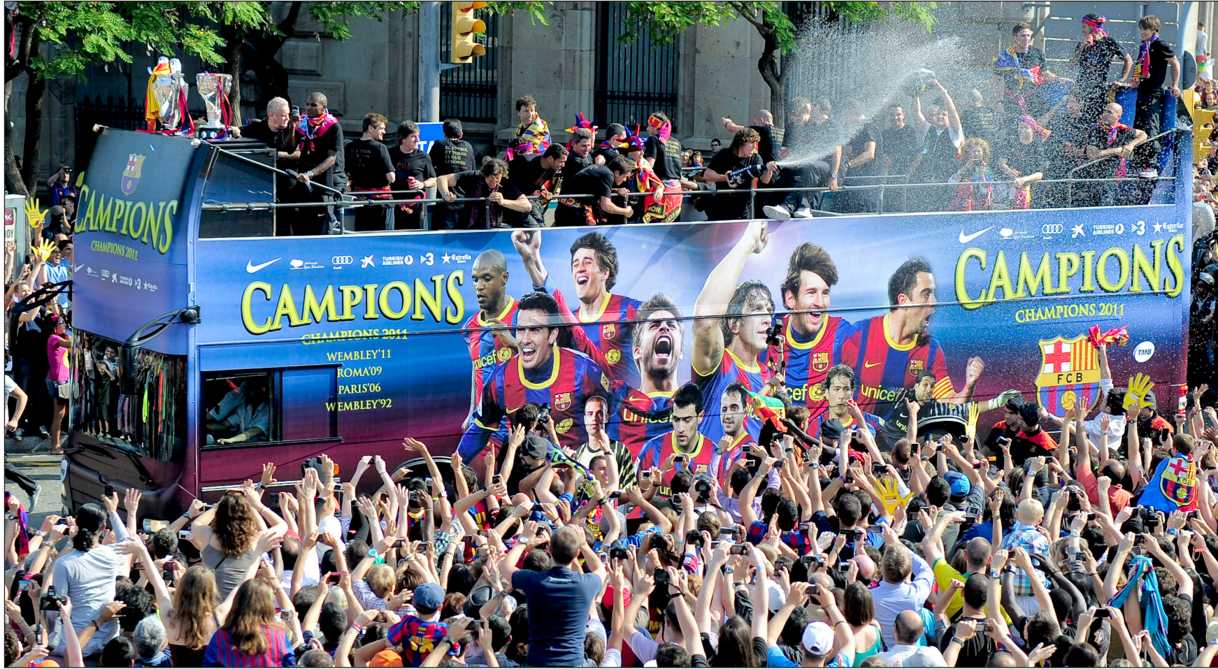
لاعبو برشلونة وسط جمهورهم الذي احتفى بهم