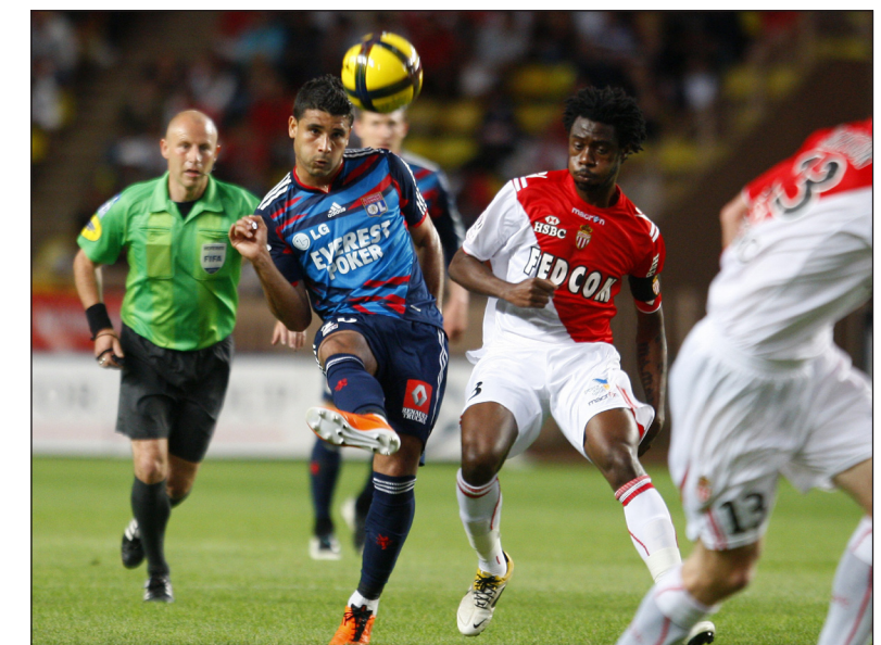
ليون تأهل بجدارة الى المسابقة الأوروبية

تأهل ليون إلى الأورال التمهيدية من مسابقة دوري أبطال أوروبا إثر فوزه على ضيفه موناكو الذي هبط إلى الدرجة الثانية - صفر، وتعامل باريس سان جرمان مع ضيفه سانت إتيان 1-1 في المرحلة الثامنة والثلاثين الأخيرة من الدوري الفرنسي لكرة القدم. واحتفظ ليون بالمرکز الثالث برصيد ٤٦ نقطة وابتعد بفارق ٤ نقاط عن باريس سان جرمان