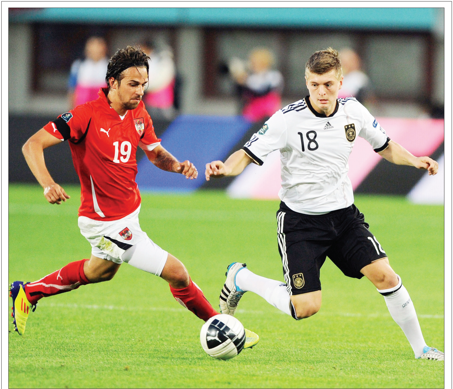
المانيا تسجل فوزاً صعباً على النمسا في التصفيات الأوروبية