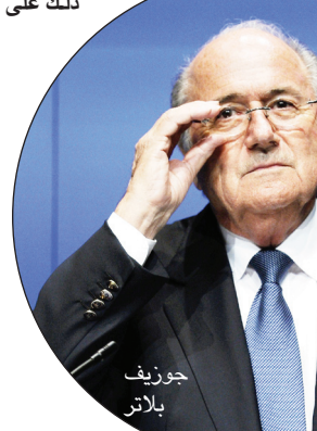
جوزيف بلا تر

مريد الإسباني كريم بنزيمة. ورفع المنتخب الفرنسي رصيده إلى 12 نقطة في الصدارة بفارق 4 نقاط عن بيلاروسيا الثانية و 5 نقاط عن كل من البانيا ورومانيا التي فازت اليوم على البوسنة 3-صفر.