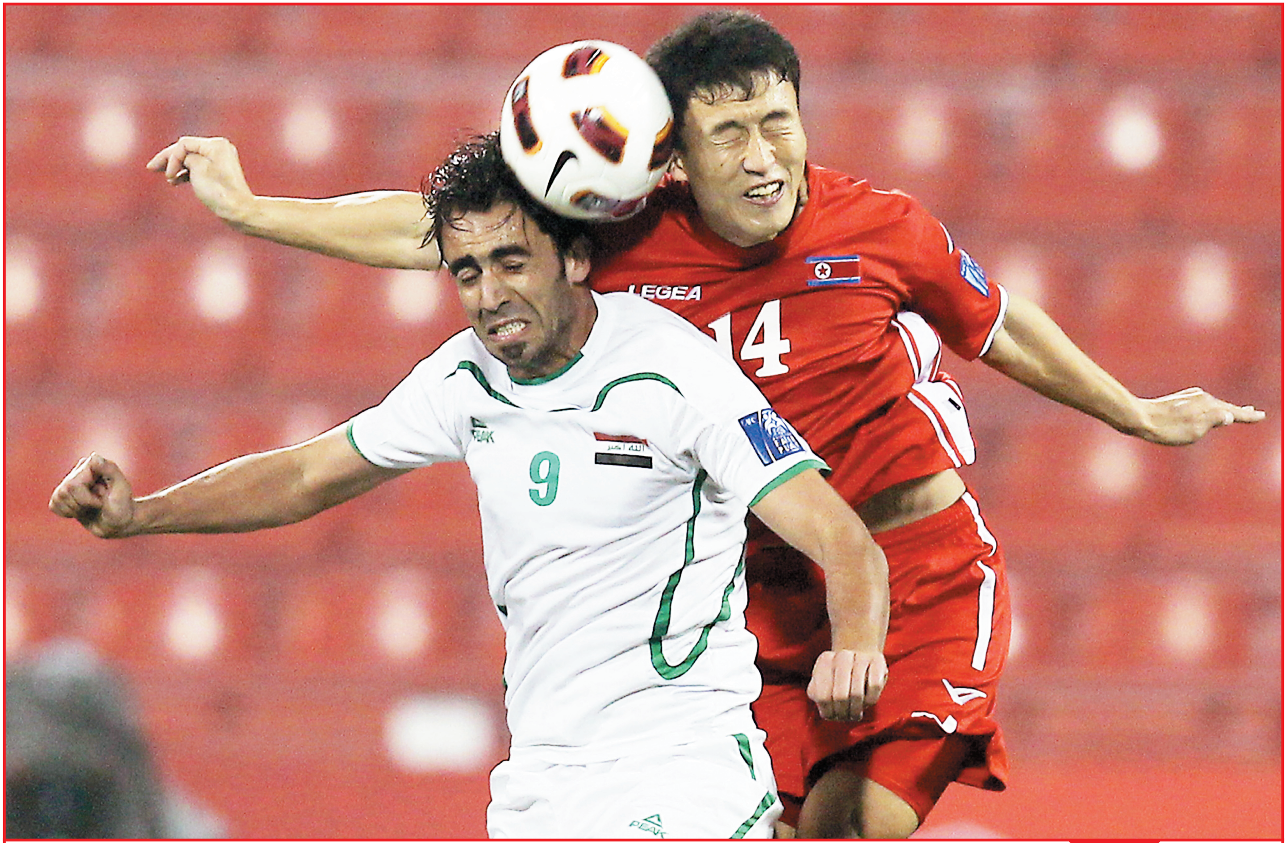
نجم منتخبنا مصطفى كريم خارج اسوار بني ياس

وتابع: من المؤسف حقاً ان يتروكنوني ممن كانوا بمثابة اقرب المقربين لي اصارع وحيداً وأفواض (فيفا) على تثبيت اللوائح والإصرار على إجراء الانتخابات في بغداد لكن جزء هذا الإحسان تحرر ضدّي مذكرات الاستجواب واستدعاء من هيئة المساءلة والعدالة والكل يعلم أن اتحادنا مؤسسة أهلية مستقلة غير تابعة للحكومة وهي مؤشرات ورسائل، بل تحذيرات شديدة أرسلت لي قائلتها مساع أخرى من أجل عرقلة مسيرتي ابتداءً بمذكرات الاعتقال وغيرها حيث الصقوا بي شتي التهم من اجل ان أترك هذا المنصب وان أكون متواجداً بعيداً عن قمة الهرم الإداري وها هو اليوم قد حان وتركت الاتحاد لهم وتلك الأساليب ليست رياضية ابداً. واختتم سعيد حديثه قائلاً: أتمنى كل الخير والتوفيق والنجاح في مسيرة رئيس الاتحاد المقبل أملاً ان يعم الخير والمحبة في ربوع بلدي الحبيب وان نتجاوز التقاطعات وان تصبح كرة القدم العراقية في أبهى صورها إن شاء الله.