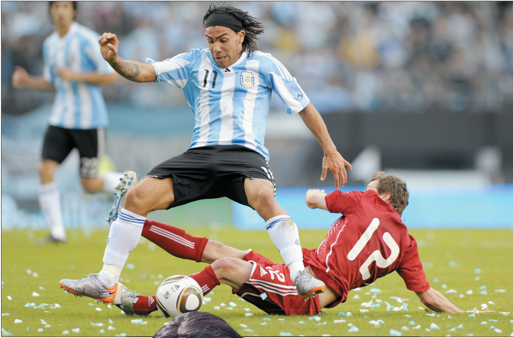
بطولة كوبا أميركا تواجه ظروف مناخية صعبة

وقال ريبيرو في تصريح تلفزيوني برازيلي: «من المتوقع أن تستمر المشكلة ليومين أو ثلاثة أيام. إذا تأكد ذلك، سأواصل بالكونمبول لمعرفة الحل. وفي الشأن ذاته أعرب إلكين سوتو لاعب خط