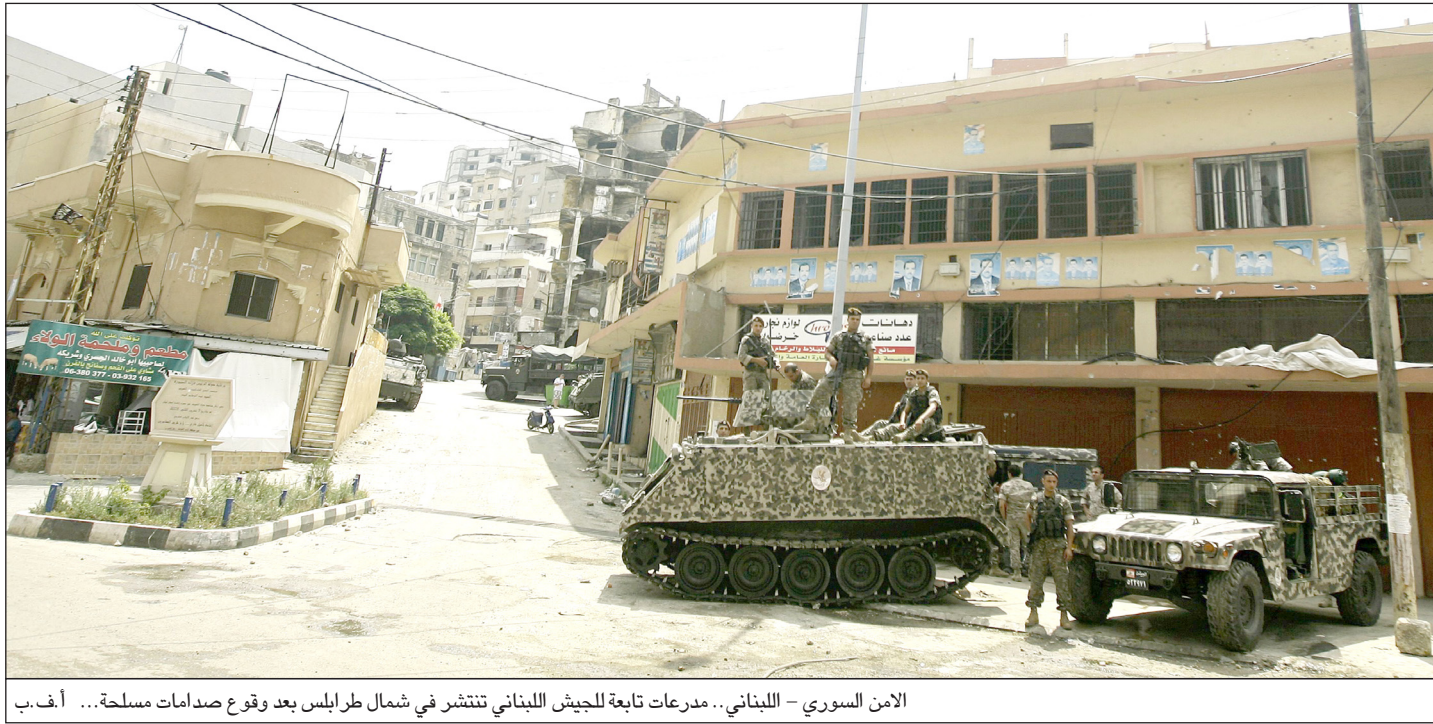
الامن السوري - اللبناني.. مدرعات تابعة للجيش اللبناني تنتشر في شمال طرابلس بعد وقوع صدامات مسلحة...