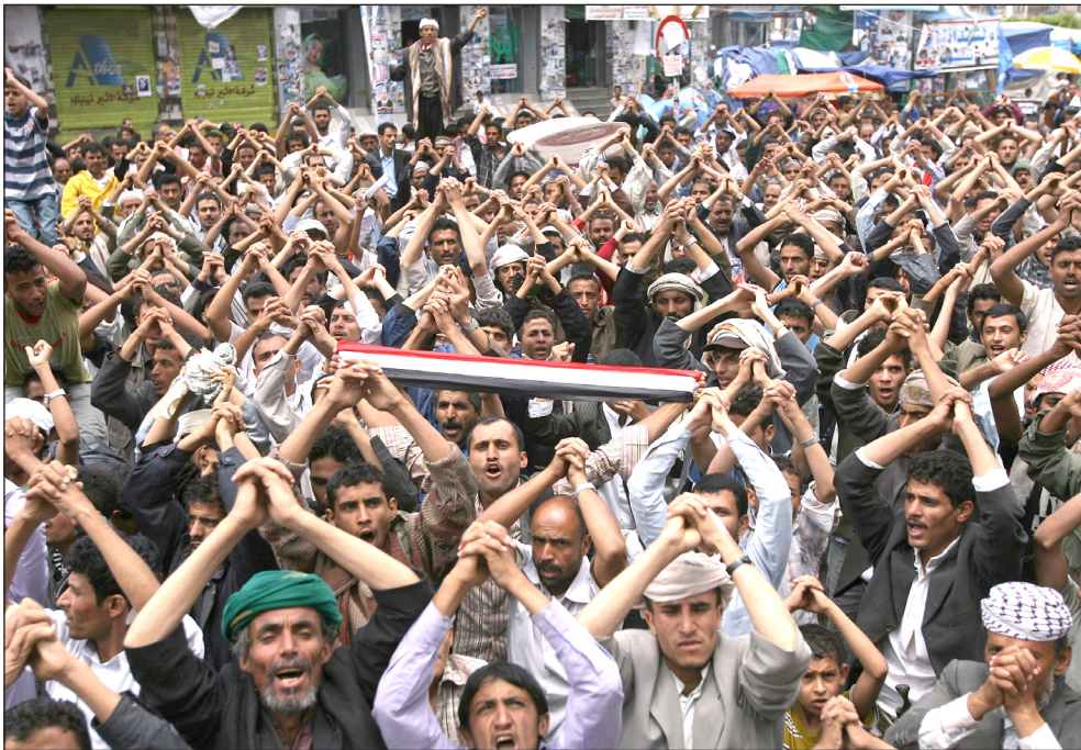
الشباب اليمني، اصرار على التغيير... أ.ف.ب

لكن العلاقة الهم كانت في اواسط ثمانينيات القرن الماضي حيث أصبحت عشيقته الجنرال