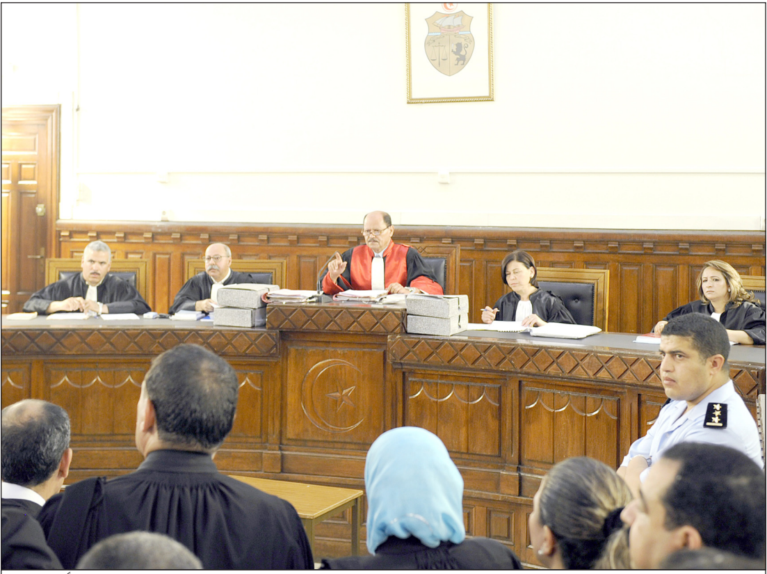
قاعة المحكمة التي يحاكم فيها بن علي وزوجته غيابياً... أ.ف.ب

حفظ النظام، كان وصل الى الحكم في ٧ تشرين الثاني/نوفمبر ١٩٨٧ بعد ان ازاح الرئيس الاسبق لتونس الحبيب بورقيبة (١٩٥٧-١٩٨٧) الذي قال اطياء انه كان يعاني المرض ويعيش في شبه عزلة في