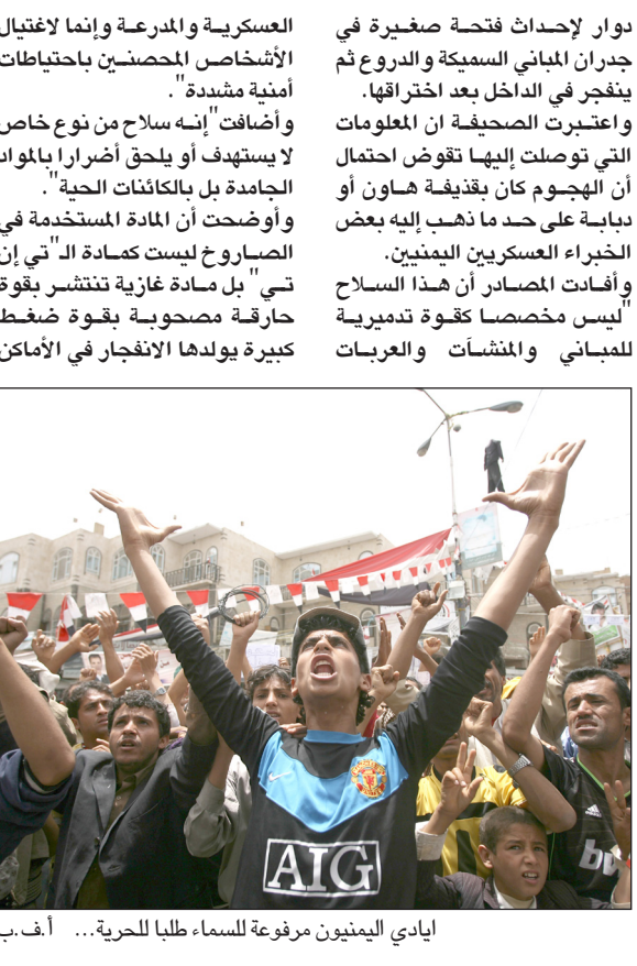
أيادي اليمنيون مرفوعة للسماء طلبا للحرية... أ.ف.ب

المغلقة. وكان قيادي بارز في الحزب الحاكم أصيب في الهجوم بفسوس بليغة في إحدى سيقانه وحرق في وجهه وفروه رأسه، أفاد أن المائدة التي أحرقت له لم تكن نارا بل غازا حارقا. وأوضح القيادي الذي رفض ذكر اسمه أن الغاز أحرق أطراف ووجوه وفروات رؤوس المصلين دون أن يحرق شعراهم. وقال "انظر، أحرقت جلدة رأسي دون أن يحرق الشعر. حدث هذا لنا جميعا." وتابع قائلا إن انفجار الصاروخ ولد ضغطا قويا إلى درجة قاتلة "لو لم يسارع الحراس الموجودون في الخارج والداخل إلى فتح كل الأبواب لفضي علينا في الداخل." وأوضحت المصادر أن فريق التحقيق يعمل لمصلحة شركة أميركية غير حكومية مختصة في التحقيقات مثل هذه القضايا، استعانت به الحكومة اليمنية، وليس تابعا لمكتب التحقيقات الفدرالي الأميركي "أف بي أي". يشار إلى أن صالح يتلقى العلاج في السعودية مع 58 من أركان حكمه أصيبوا في الانفجار الذي استهدف المسجد الرئاسي.