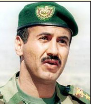
احمد علي عبد الله صالح

ووفقا لصحيفة عكاظ السعودية، فان الفسيل توفي في مستشفى القوات المسلحة في البها بالطائف (غرب) السبت متأثراً بإصابته البالغة التي تعرض لها في الهجوم على مسجد القصر الرئاسي.