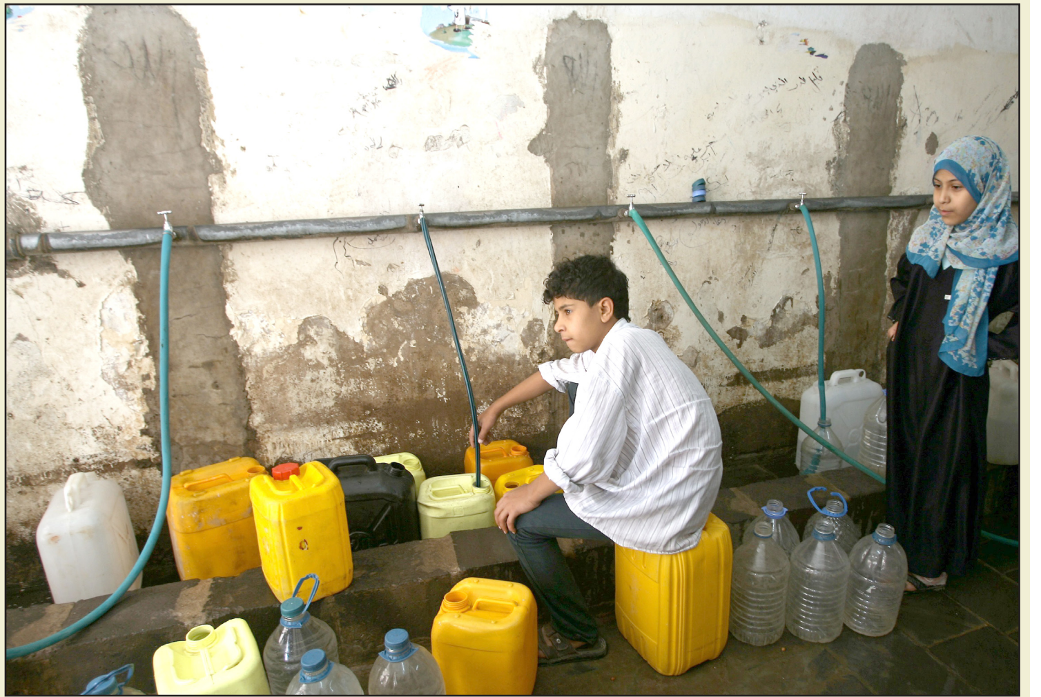
■ اطفال يمنيون يحاولون الحصول على مياه للشرب...

وحول الانتقادات التي يوجهها البعض للموقف الروسي بقلبه وانحياز.. أكد السفير الروسي أن موقف بلاده أصبح أكثر مرونة وبرامغامية مقارنة مع مواقف الاتحاد السوفيتي لكنه غير متقلب وغير عشوائي ولا يمكن وصفه بأنه لا مبدئي.