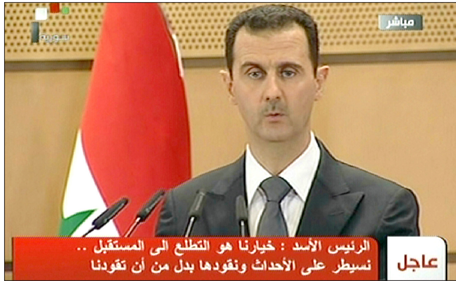
الرئيس السوري بشار الأسد خلال لقائه كلمته..... نقلا عن التلفزيون السوري

وقدم الرئيس السوري خلال خطابه التعازي لأسر وأهالي