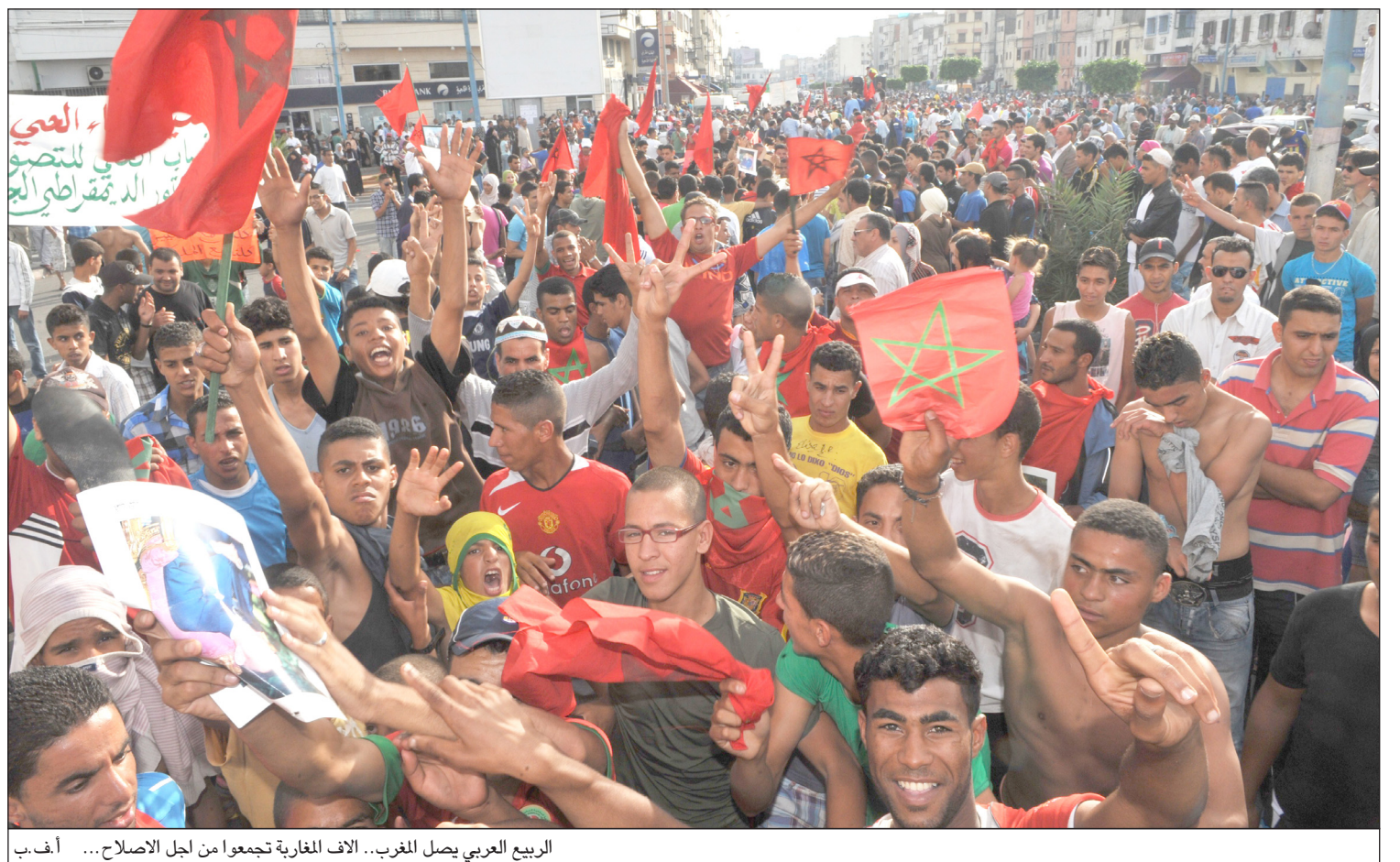
الربيع العربي يصل المغرب.. الاف المغاربة تجمعوا من أجل الإصلاح... أ.ف.ب

□ الدار البيضاء / رويترز نظم آلاف عدة مسيرات عبر الدار البيضاء اكبر مدن المغرب الأحدث للاحتجاج على ما وصفوه بعدم كفاية الإصلاحات الدستورية التي كتشف عنها العاهل المغربي محمد السادس الاسبوع الماضي.