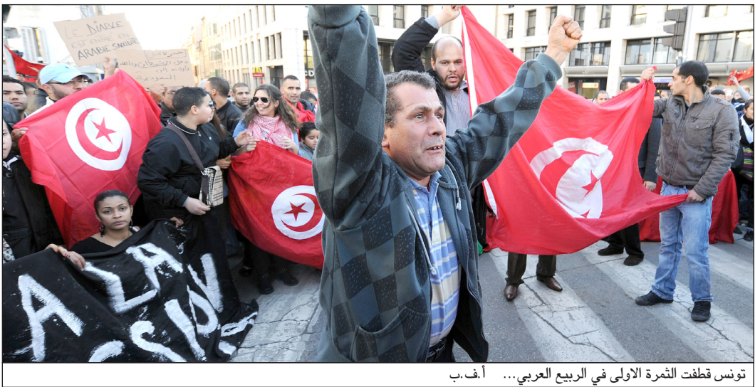
تونس قطعت الثمرة الأولى في الربيع العربي...

بهم اثنان من المعارضين الذين أمضى أحدهما ١٥ عاما في السجن والآخر ٣٠ عاما لي جانب وزير العدل السابق في نظام القذافي.