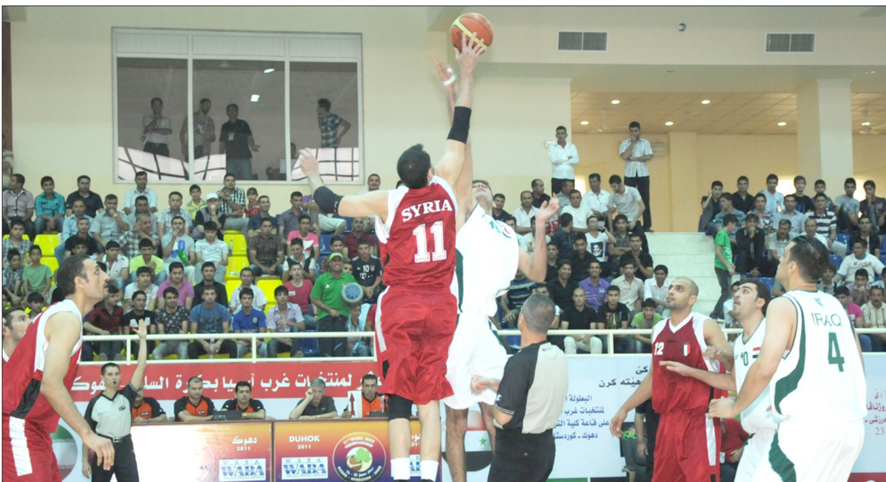
منتخبنا السلوي يتعرض لخسارة ثانية أمام الأردن بفارق نقطتين

وأضاف خارجريان : ان المنتخب الإيراني ضمن التأهل الى النهائيات الى جانب منتخبنا الوطني وسوريا، علما ان دول غرب آسيا تعد من الفرق القوية على صعيد الفارة الآسيوية ويعد منتخب إيران بطل النسخة الماضية والأردن صاحب المركز الثاني، وهذا التفوق يعطي دفعا معنويا لفرق غرب آسيا من أجل تطوير مستوياتها الفنية نحو الأفضل .