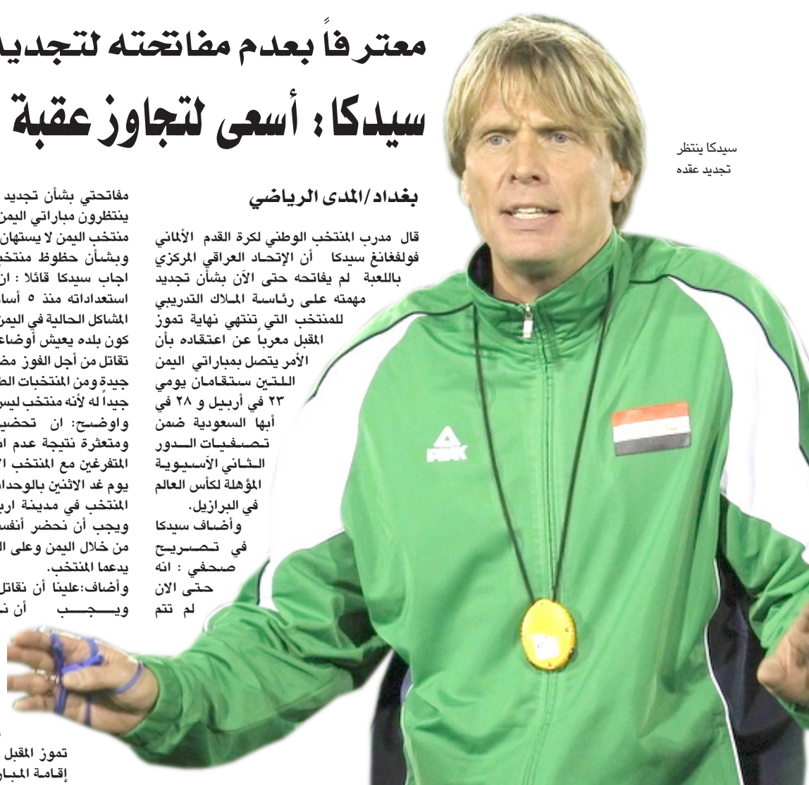
سيدكا يتنظر تجديد عقده

وسيتم تصنيف المحافظات حسب مشاركتها وبناتجها ويحدد نشاط ومدربي الاتحاد الفرعي في حال لم يصفوا ضمن الـ١٥٠ محافظة الأولى . ويرشح الفائزين الأربعة الأوائل للذكور والإناث من كل فئة إلى نهائي الفئات العمرية الذي سيقام في تموز المقبل.