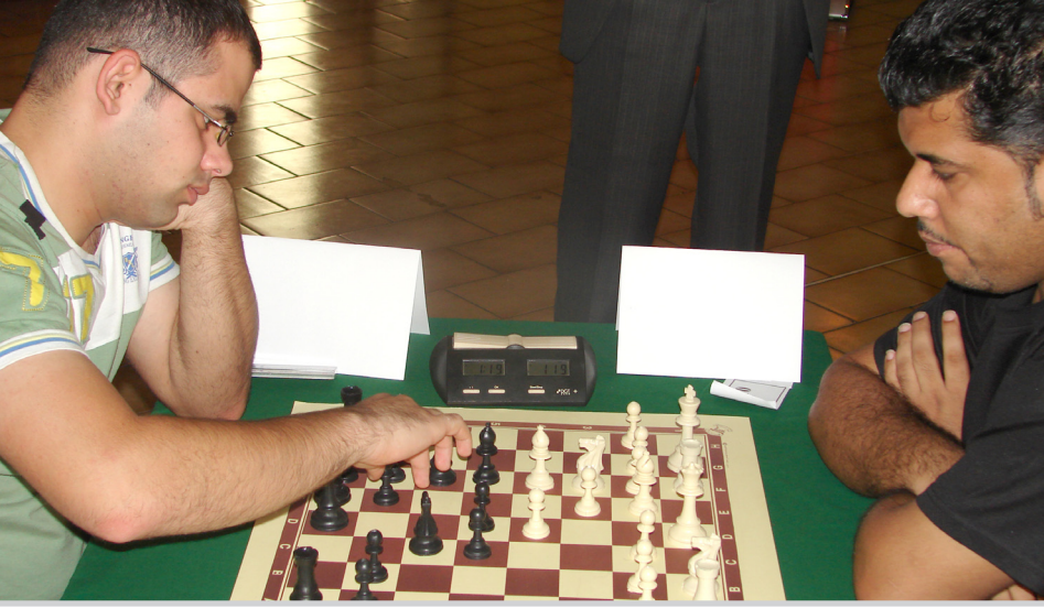
جانب من إحدى بطولات الشطرنج المحلية