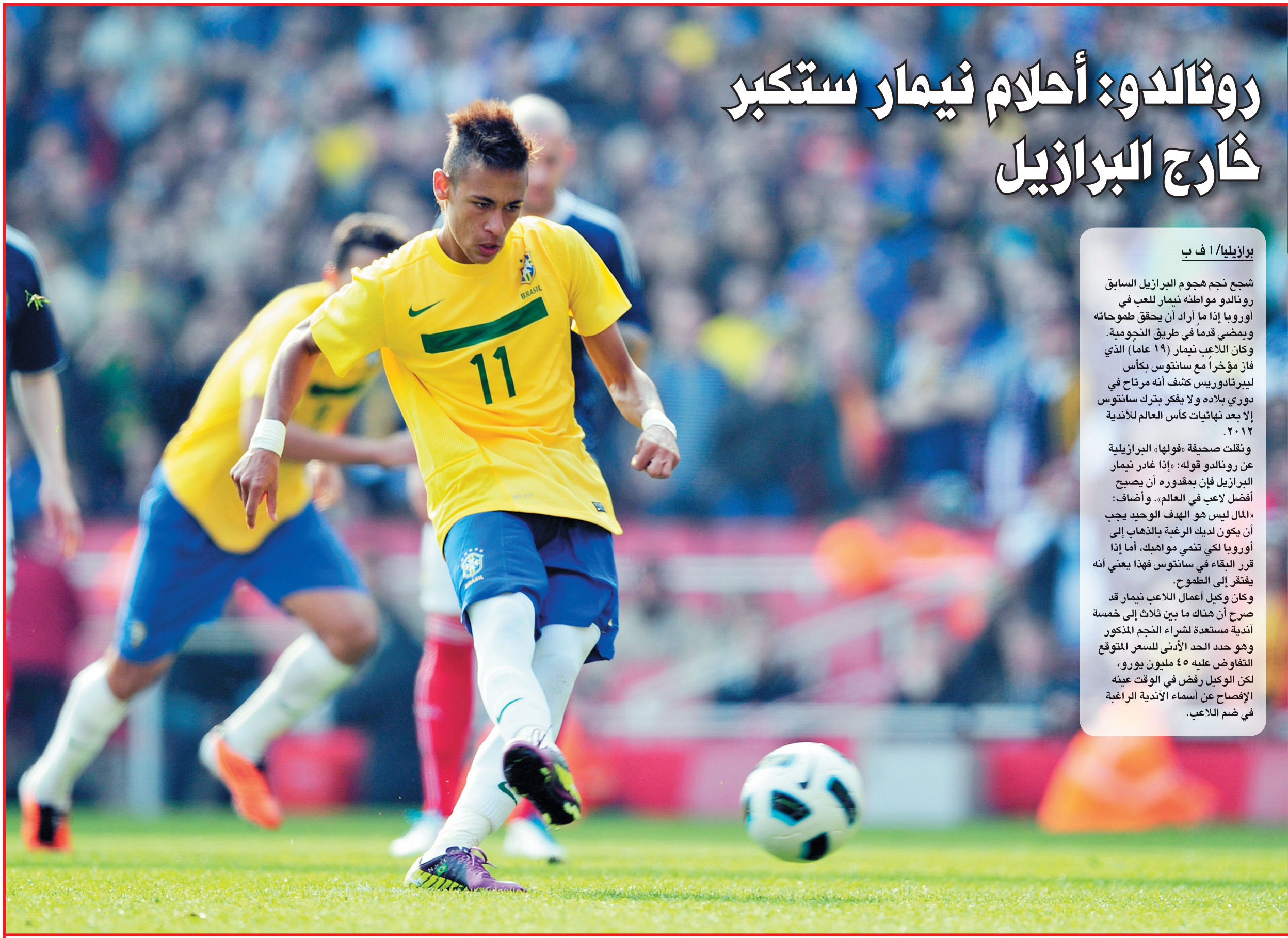
خمسة أندية تتفاوض نيمار مقابل 45 مليون يورو كحد أدنى .. ا ف ب

وكان وكيل أعمال اللاعب نيمار قد صرح أن هناك ما بين ثلاث إلى خمسة أندية مستعدة لشراء النجم المذكور وهو حدد الحد الأدنى للسعر المتوقع التفاوض عليه ٤٥ مليون يورو، لكن الوكيل رفض في الوقت عينه الإفصاح عن أسماء الأندية الراغبة في ضم اللاعب.