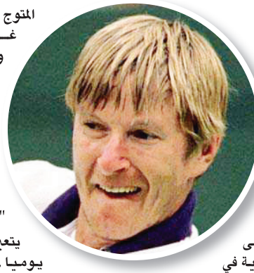
المتوج بلقبين كبيرين (رولان غاروس عام 1996 واستراليا عام 1999) "أكتع بانني قادر على لعب الغولف بتقنيي باللقب الوطني". واختم قائلا: "أعرف بأنه يتعين عليّ التدريب يوميا لمدة ساعات حتى أبلغ المستوى الاحترافي، الآن لدي ما يكفي من الوقت والرغبة وأنا أعشق لعب الغولف". يذكر أن كافنيكوف اعتزل اللعب أواخر عام 2003 بعد مسيرة حافلة بالإنجازات بدأت مع عام 1992 توجهاً بـ 26 لقباً في الفردي علماً أنه خسر 20 مباراة نهائية في 27 في الزوجي (4 القاب كبرى بينها 3 في رولان غاروس وواحد في فلاندينغ ميدوز) وخسارة 14 مباراة نهائية.

أكد نجم كرة المضرب الروسي السابق يفغيني كافنيكوف أنه يهدف إلى المشاركة في مسابقة الغولف في دورة الألعاب الأولمبية المقررة عام 2016 في ريو دي جانيرو. وقال كافنيكوف (37 عاما) في تصريحات لوسائل الإعلام الروسية: "تبقى 5 أعوام على انطلاق دورة الألعاب الأولمبية في البرازيل"، مضيفاً: "هذه المدة طويلة وكافية لأبلغ مستوى جيداً في الغولف". وتابع كافنيكوف المصنف أول عالمياً سابقاً والمتوج بالذهب الأولمبي في مسابقة كرة المضرب عام 2000 في سيدني: "لست متأكد من قدرتي على التأهل إلى دورة الألعاب الأولمبية، لكني أرغب في معرفة ما أنا قادر على فعله، اتخذت هذا القرار بعد فوزي مؤخراً ببطولة روسيا في الغولف". وأوضح كافنيكوف