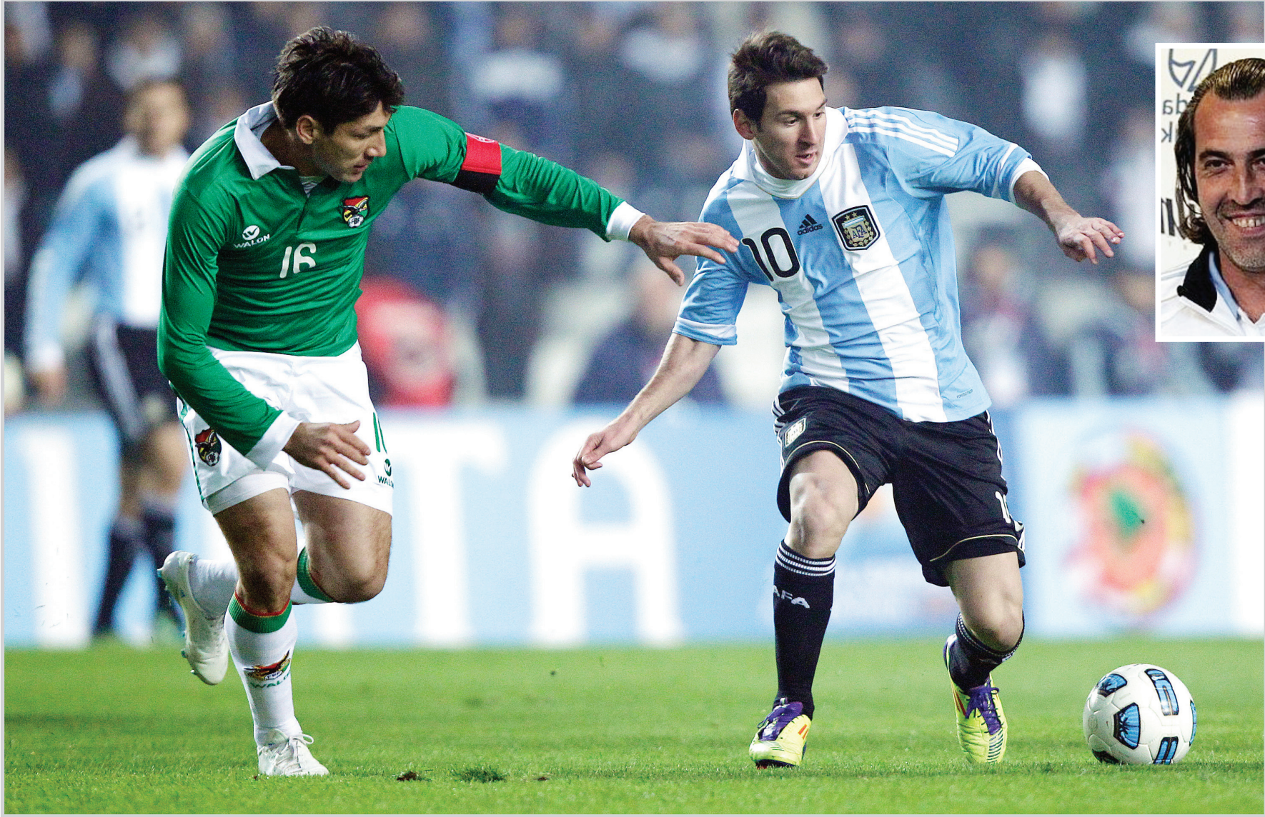
الأرجنتين تواجه محنة كوستاريكا

وغيرهم لم يقدم أداءً مقنعاً في المبارتين الأولىين لا بل ان بوليفيا وكولومبيا اللتين تقلان شأنهما تفوقتا عليه خلال مجريات اللعب وكانتا تستحقان الخروج بالتعادل الثالث لكلا المبارتين. واعترف النجم المخضرم للمنتخب الأرجنتيني خافيير زانيتي بخيبة الامل جراء العرضين دون المستوى الذي قدمهما منتخب بلاده وقال اللاعب